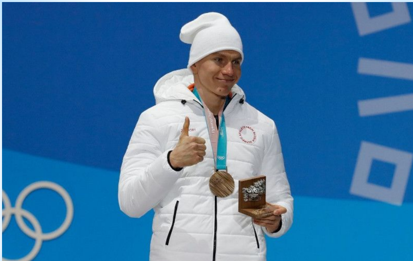
* Александр Большунов