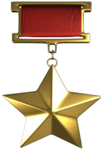
Медаль «Золотая Звезда» № 3213 (24.12.1943)