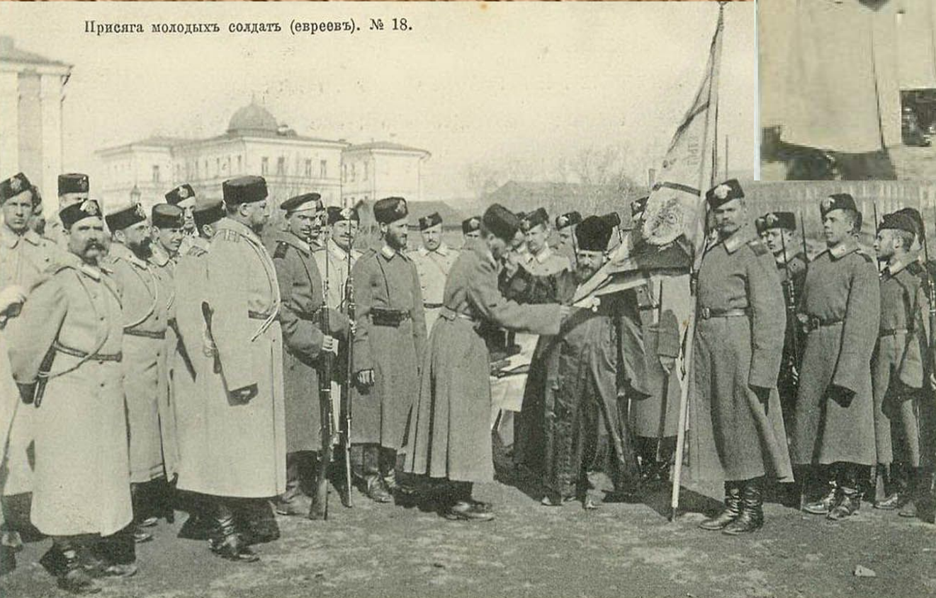
Присяга молодых солдатъ (евреевъ). № 18.