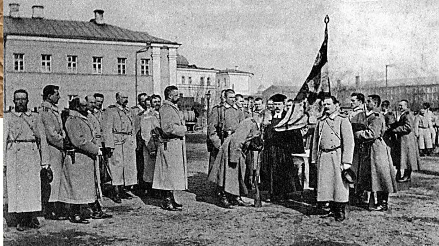
Присяга молодых солдатъ