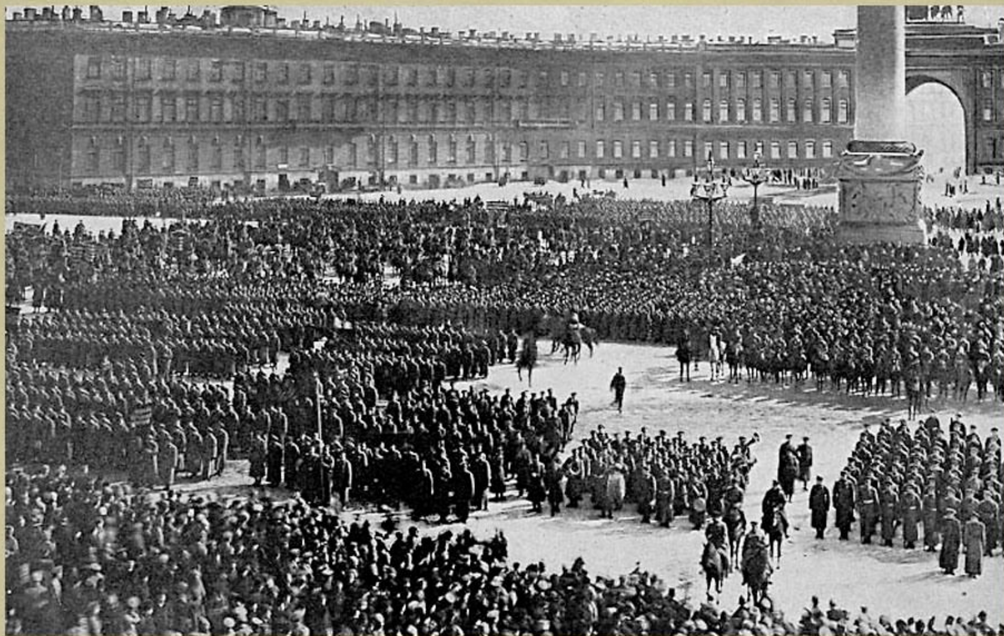
Офицеры расположенных в Петрограде частей дают присягу на "преданность революции"