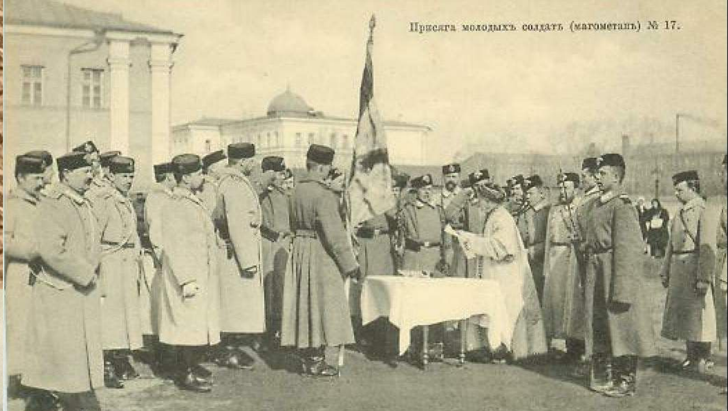
Присяга молодых солдатъ (магометанъ) № 17.