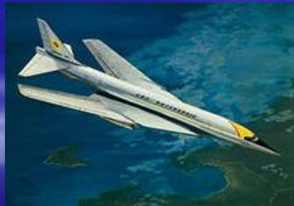
Boeing-733 Сверхзвуковой пассажирский самолет.