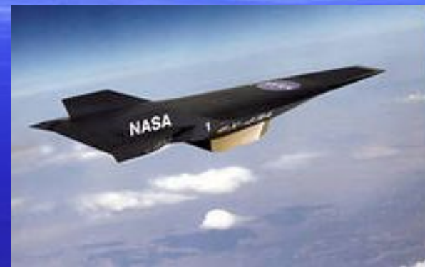
гиперзвуковой, наса, беспилотный, Самолёт, наса, x-43a