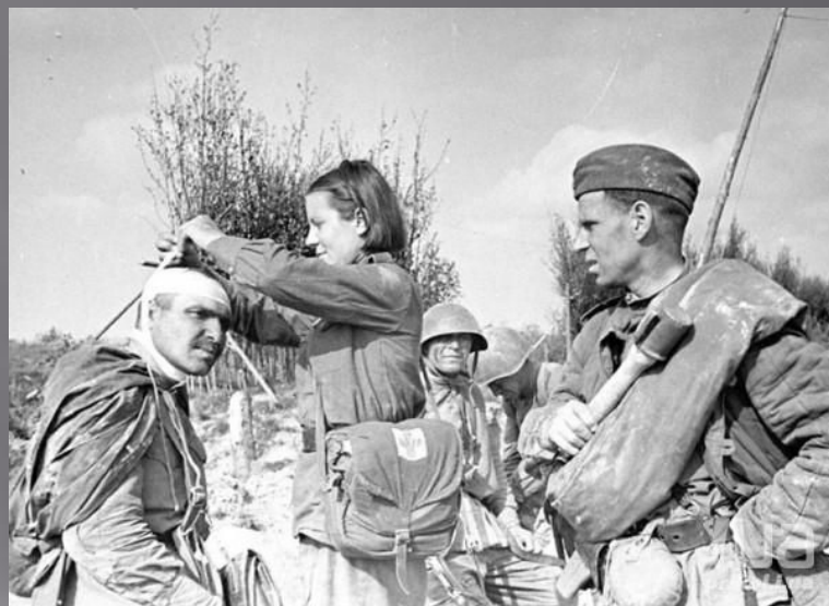
Батальонный медицинский пункт в блиндаже.