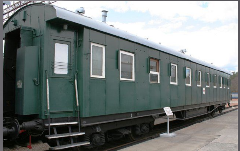
Вагон военно-санитарного поезда времен ВОВ