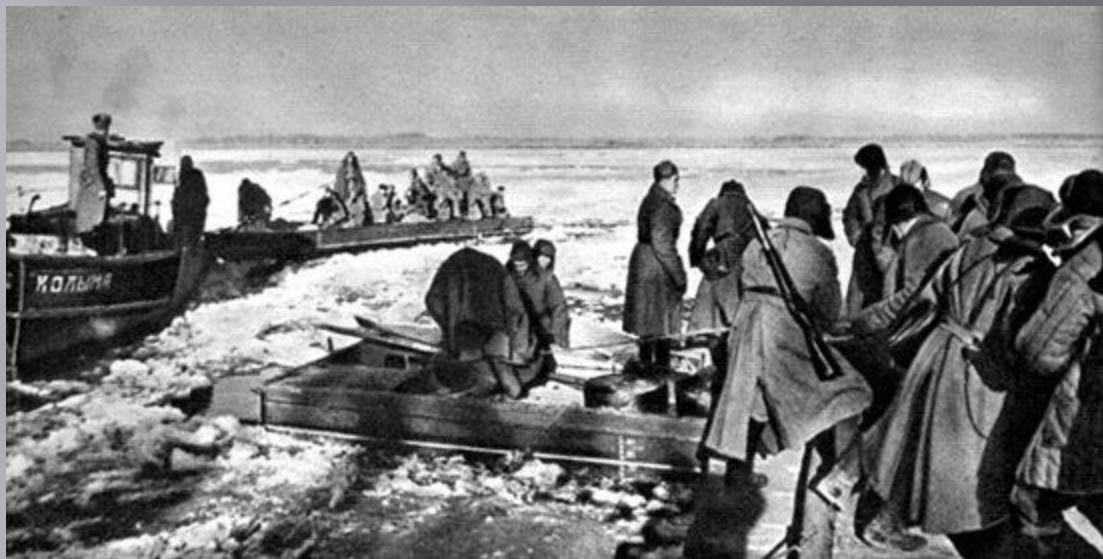
Переправа раненых через Волгу. Сталинград.