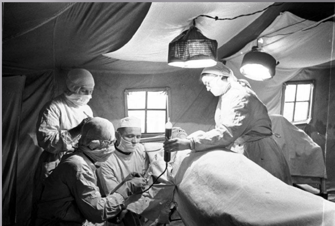
Переливание крови во фронтовых условиях. 1942 год.