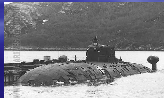
ПЛА пр.945 "Кострома" в губе Ара. СФ. Июнь 1997 года.