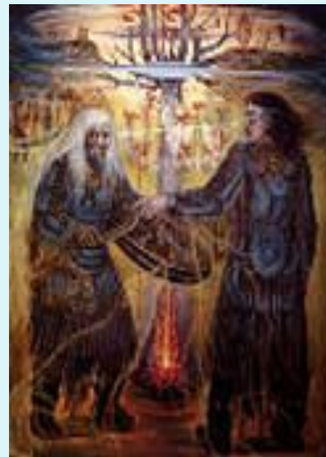
Обряд кормления огня