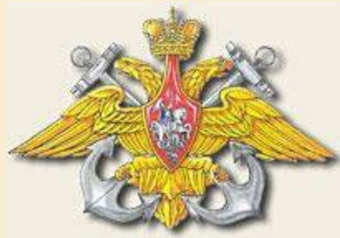
Эмблема ВМФ Росси