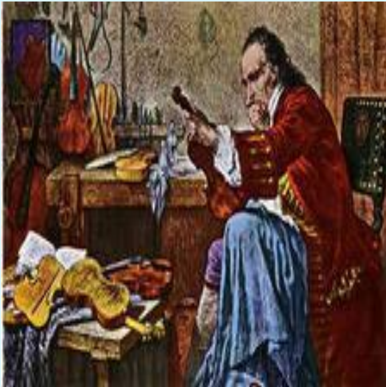
Антонио Страдивари (1644-1737 гг.)