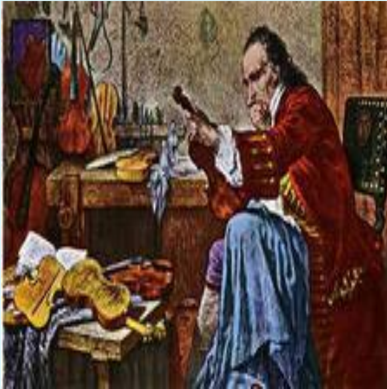
Антонио Страдивари (1644-1737 гг.)