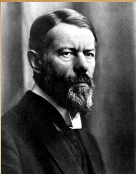
крупный немецкий социолог и экономист