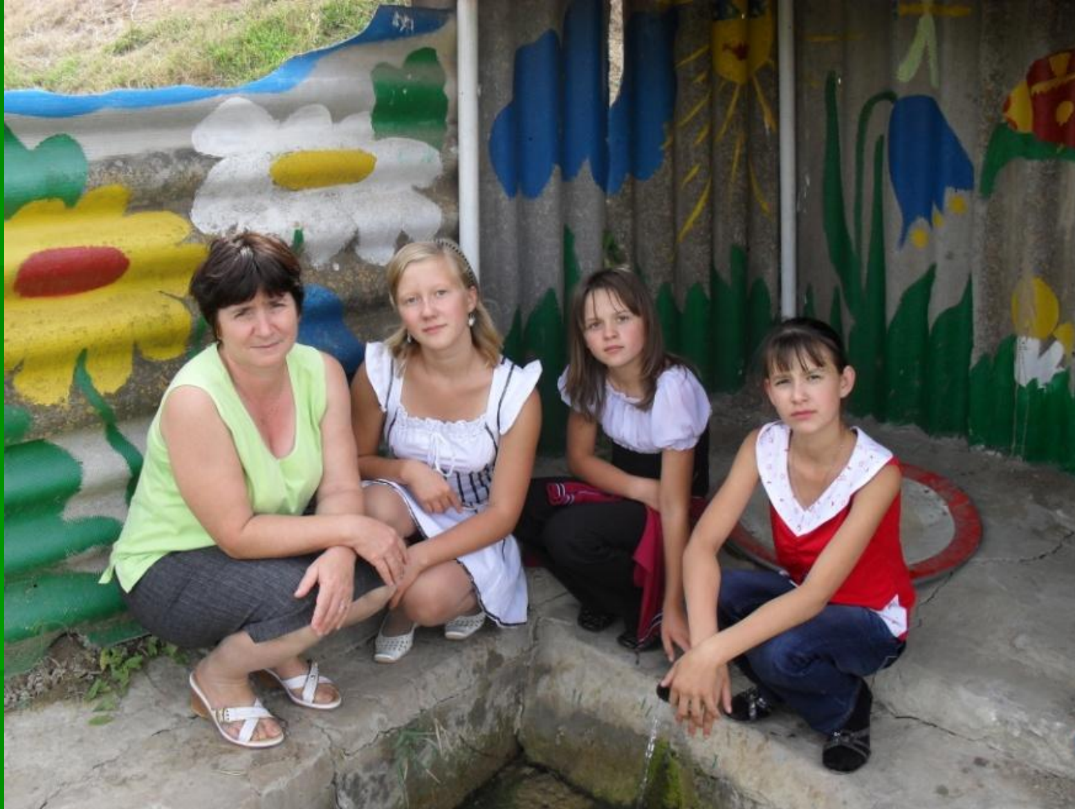
Родник у х.Пристеновский