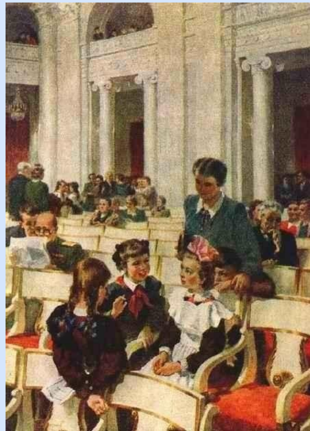
В. Корнеев "Школьники на концерте"

Искусство действует на чувства людей независимо от социальной и национальной принадлежности. Оно не признает деления между людьми, но требует от человека определенного умения, мастерства восприятия прекрасного – эстетической культуры.