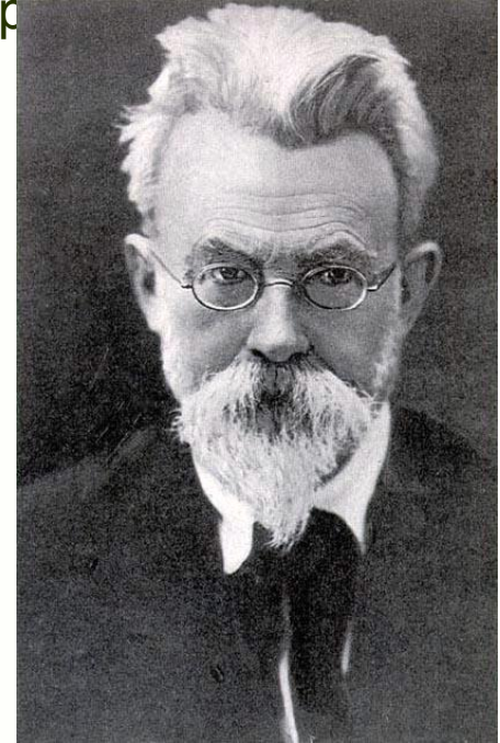
В.И. Вернадский (1863-1945)