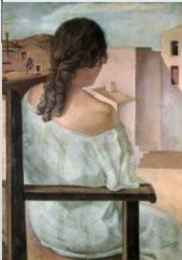
Девушка сидящая спиной. С.Дали