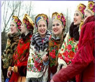
Русские - крупнейший по численности народ в России.