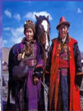
Алтайский народ .