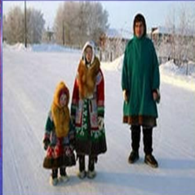
Ханты - коренной народ севера Сибири численностью 29 тыс человек.