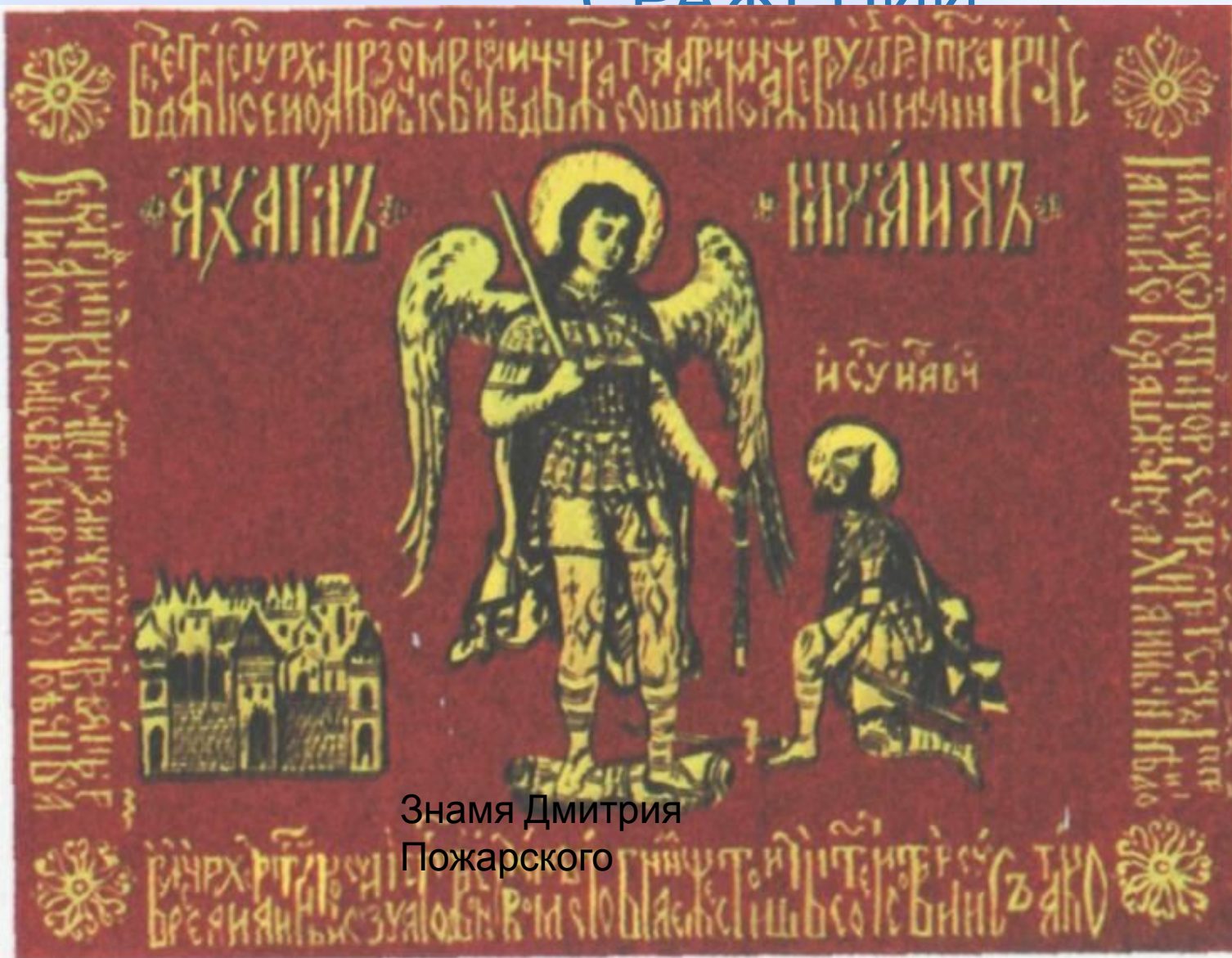
Знамя Дмитрия Пожарского