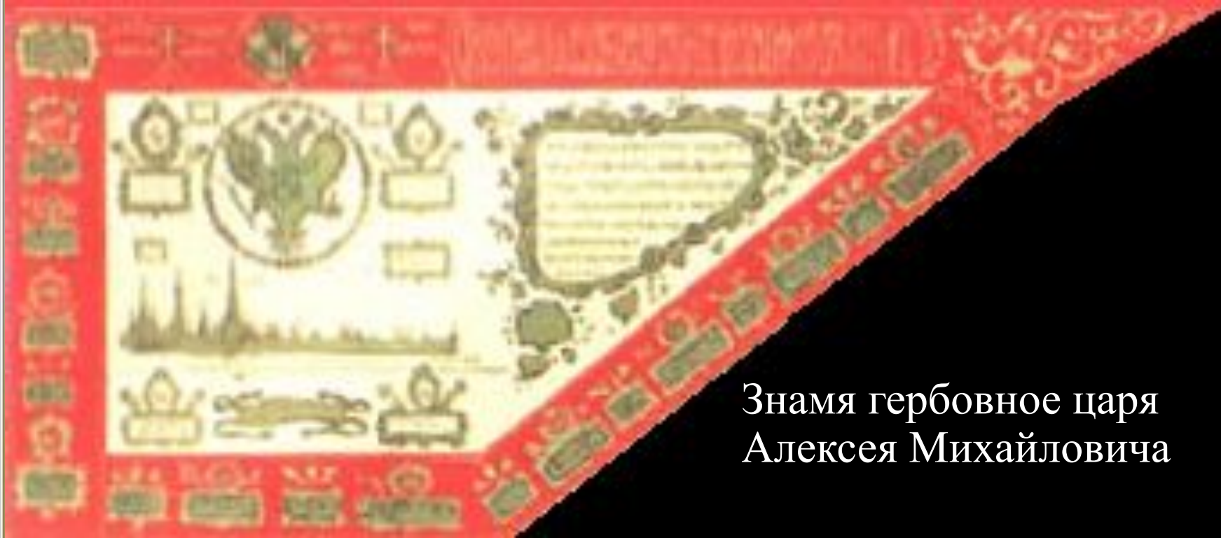
Знамя гербовное царя Алексея Михайловича

Флаг Алексея Михайловича. Впервые был поднят на русском военном корабле «Орёл» в 1668 году.