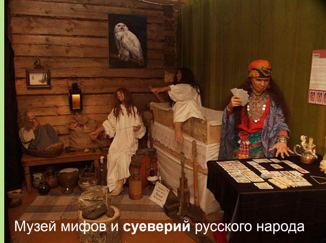
Музей мифов и суеверий русского народа

Церковь всегда осуждала веру людей во всевозможные приметы и суеверия.