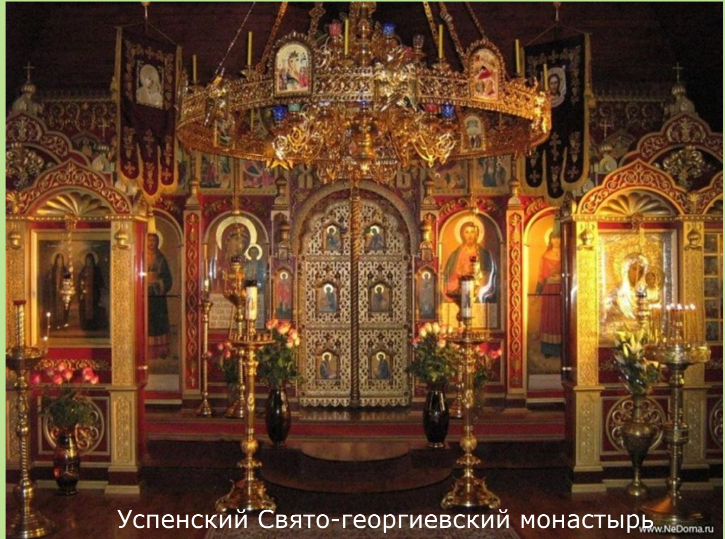
Успенский Свято-георгиевский монастырь

Это считалось и продолжает считаться мракобесием и слабостью невежественных людей