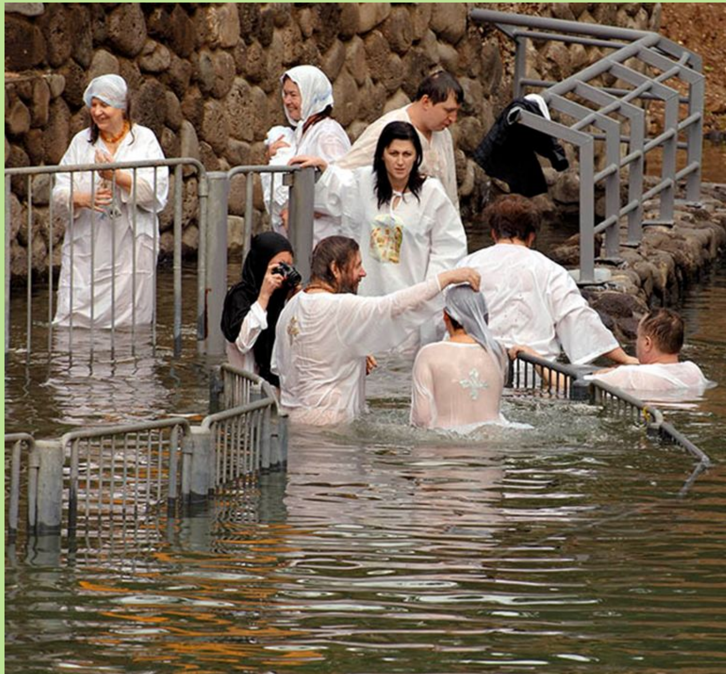
Русские паломники. Крещение в Иордане

Часто очень трудно отличить духовный опыт от эмоциональных переживаний, и настоящий паломник не может ожидать чудесной перемены в себе или своих обстоятельствах от таких переживаний.