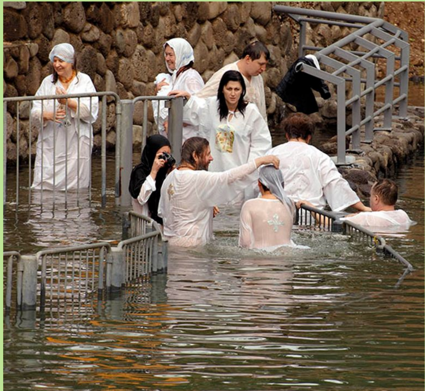
Русские паломники. Крещение в Иордане

Часто очень трудно отличить духовный опыт от эмоциональных переживаний, и настоящий паломник не может ожидать чудесной перемены в себе или своих обстоятельствах от таких переживаний.