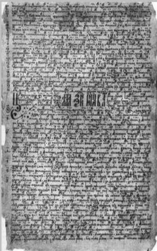
Судебник Ивана IV. 1550 г. Фрагмент

1497 г. – принятие Судебника – первого законодательного кодекса Российского государства