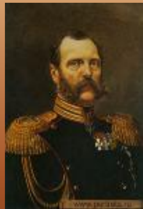
□ Александр II