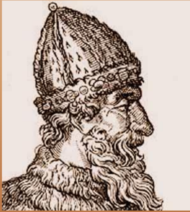
■ Иван III