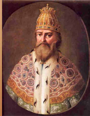
■ Иван Грозный