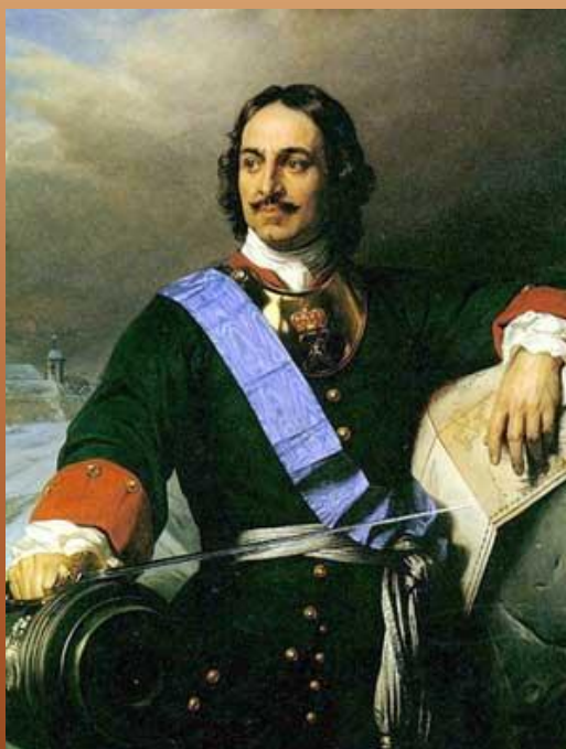
□ Петр I