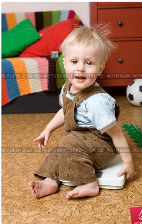
Мальчик сидит на весах