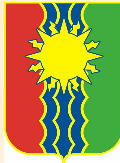
Герб г. Братска