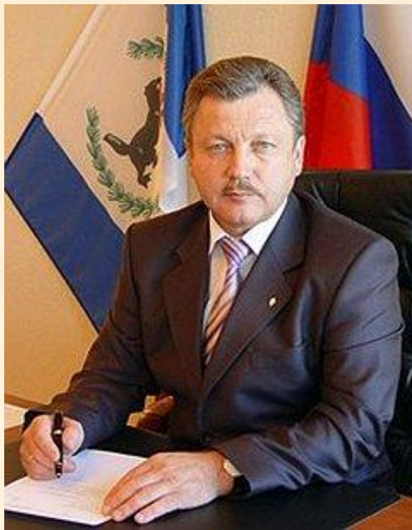
С.В. Серебрянников – мэр г. Братска