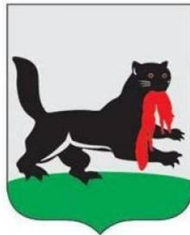
Герб Иркутской области