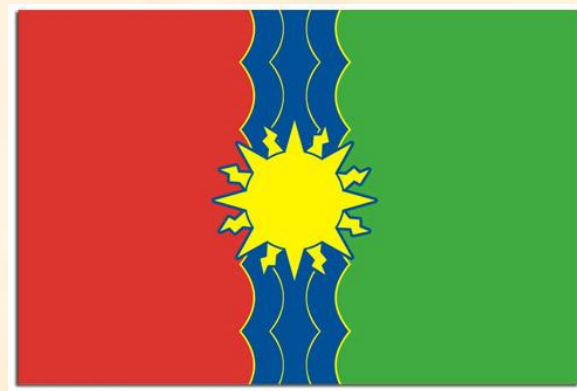
Флаг г. Братска