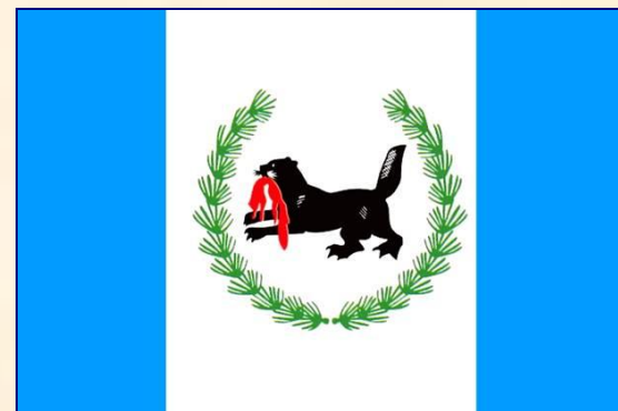
Флаг Иркутской области