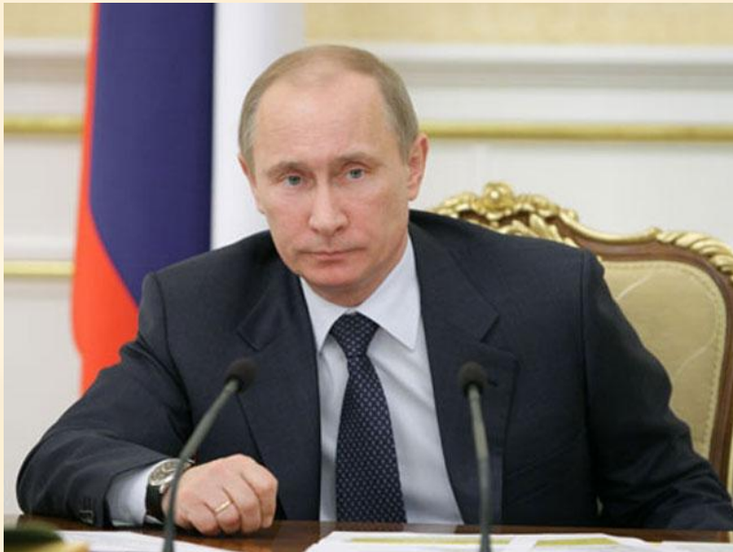
В. В Путин – президент России