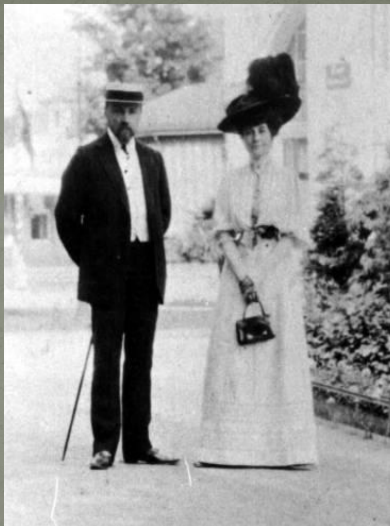
Николай Константинович и Елена Ивановна Рерихи