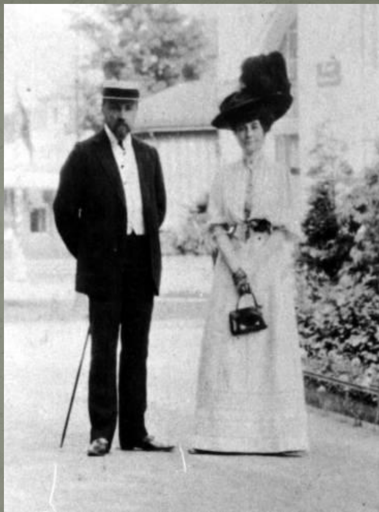
Николай Константинович и Елена Ивановна Рерихи