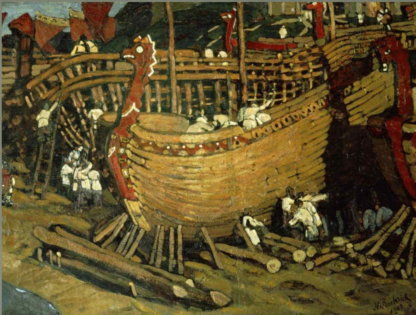
«Строят ладьи» (1903)