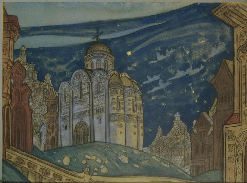
«Путивль. Затмение» (1914)