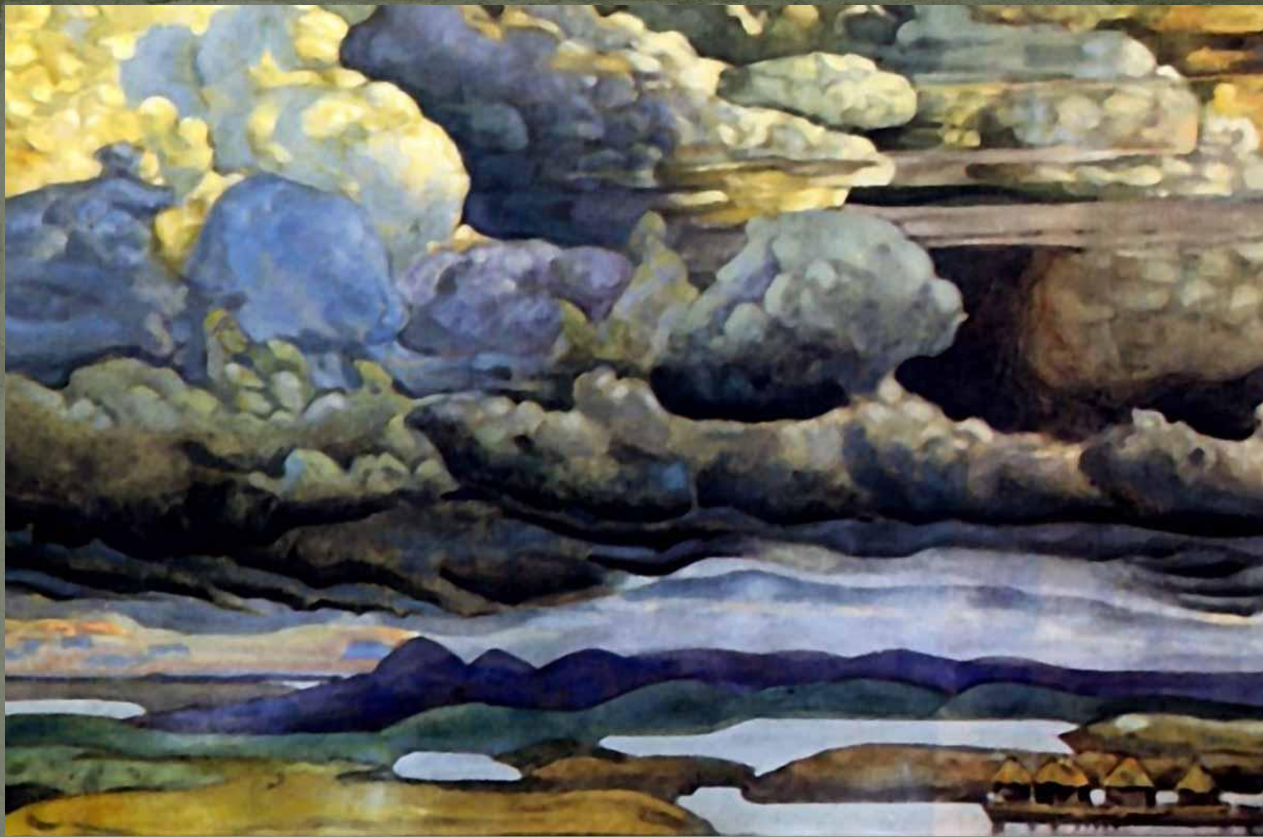
«Небесный бой» (1912)