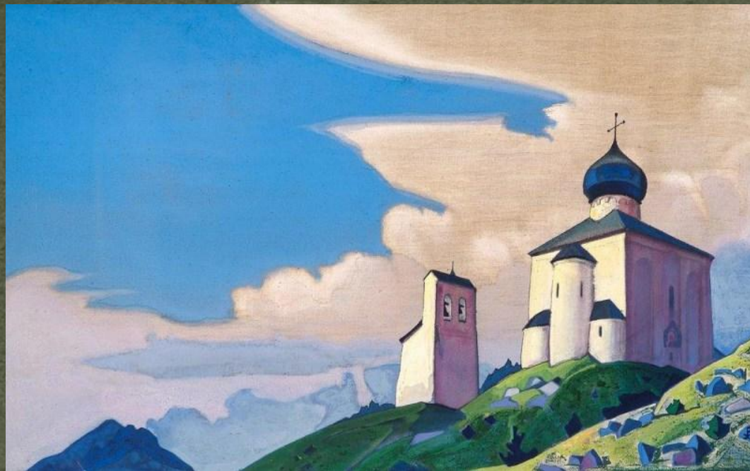
«Сергиева пустынь» (1933)