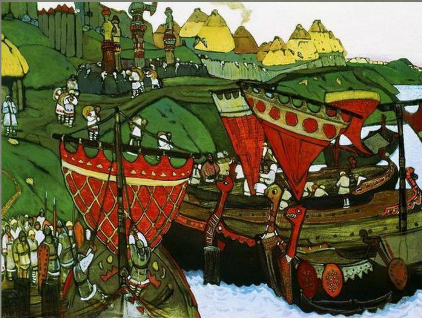
«Славяне на Днепре» (1905)