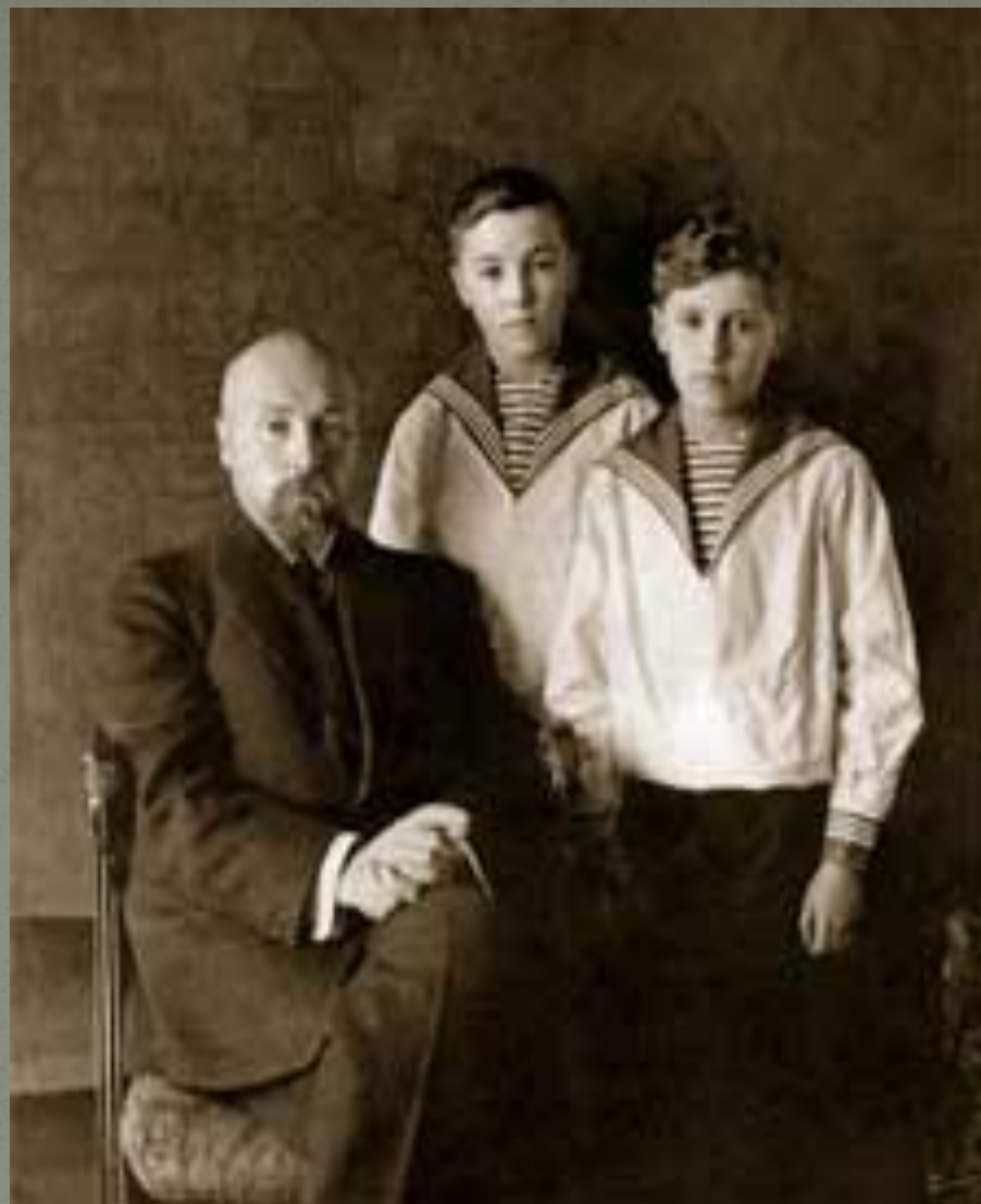
Рерих с сыновьями Юрием и Святославом