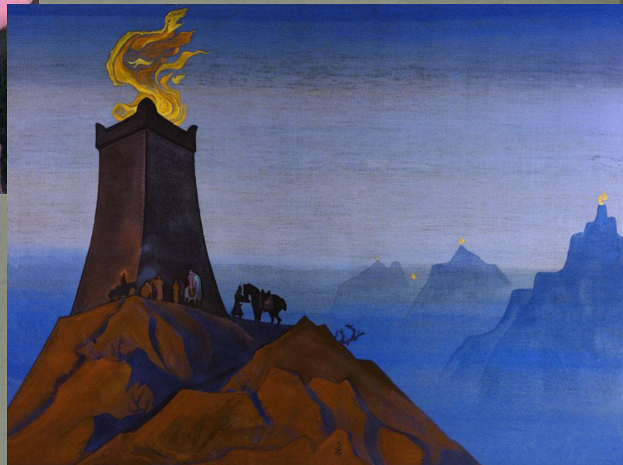
Цветы Тимура. Огни победы (1931)