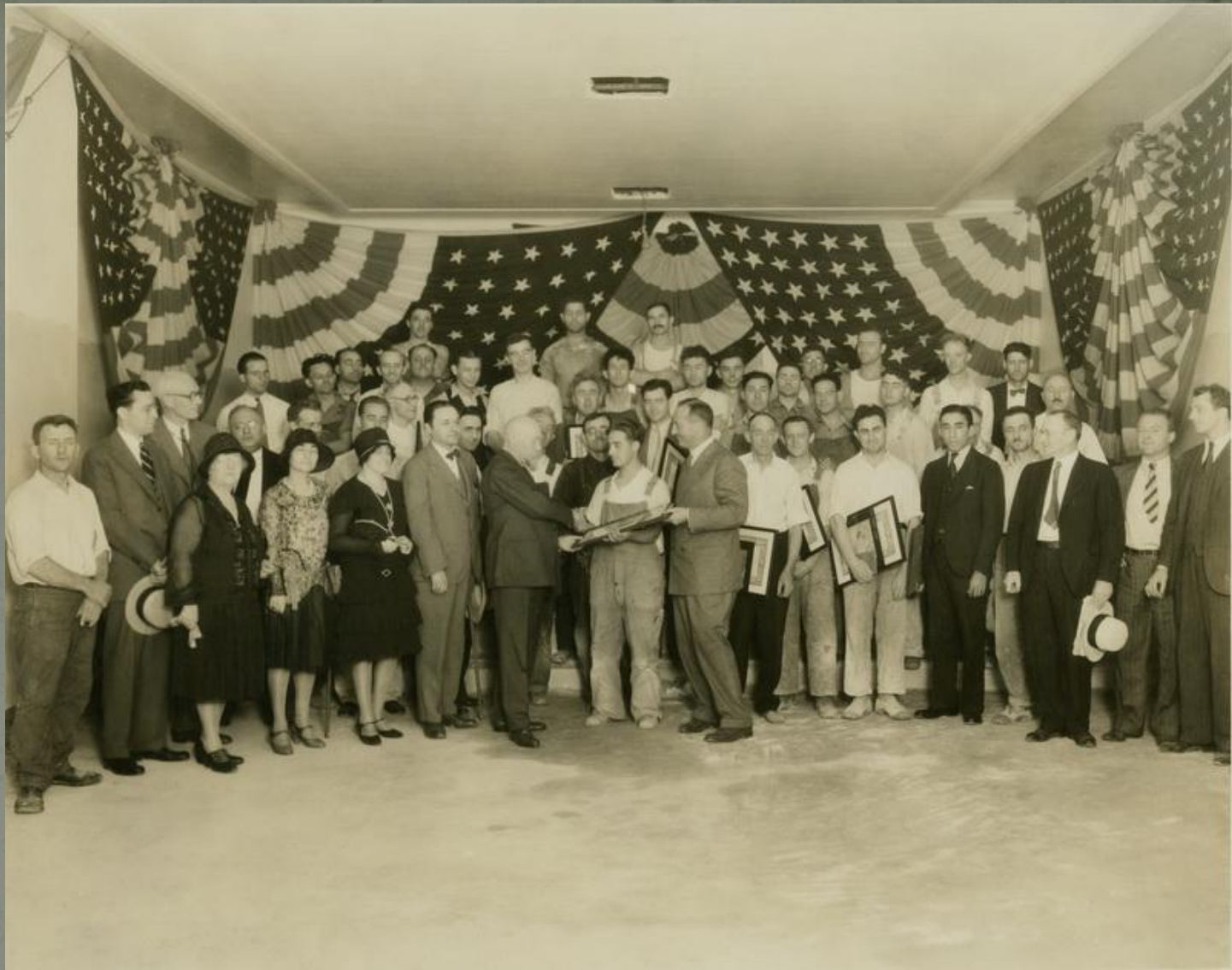
Рерих и создатели его музея в Нью-Йорке