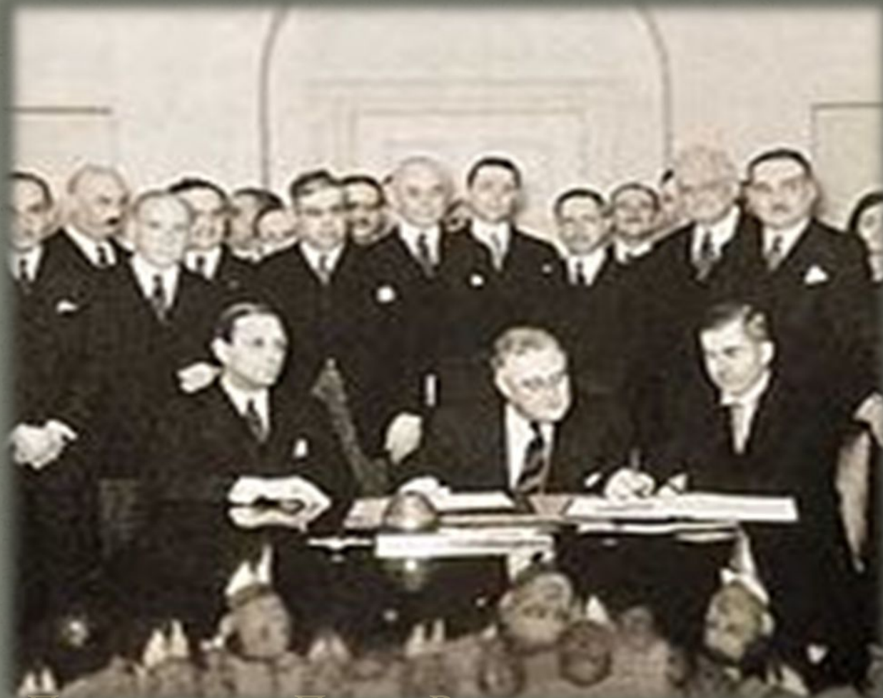
Подписание Пакта Рериха 15 апреля 1935 год (в центре: Президент США Ф. Рузвельт)