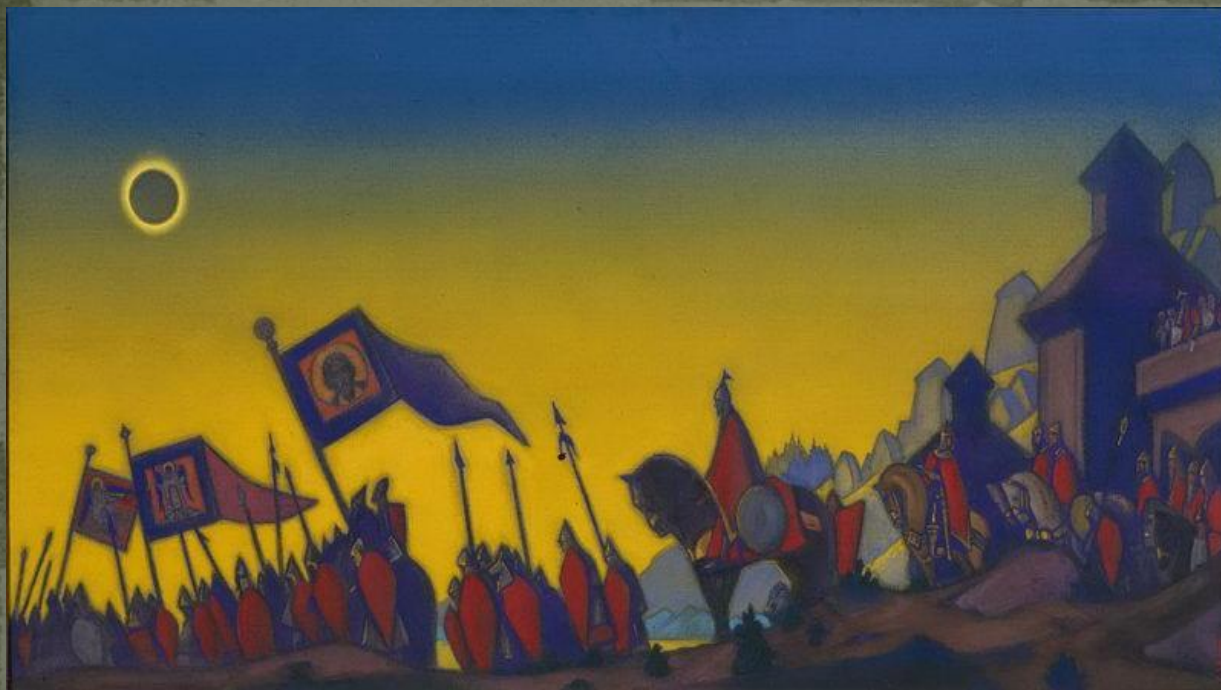
«Поход Игоря» (1942)