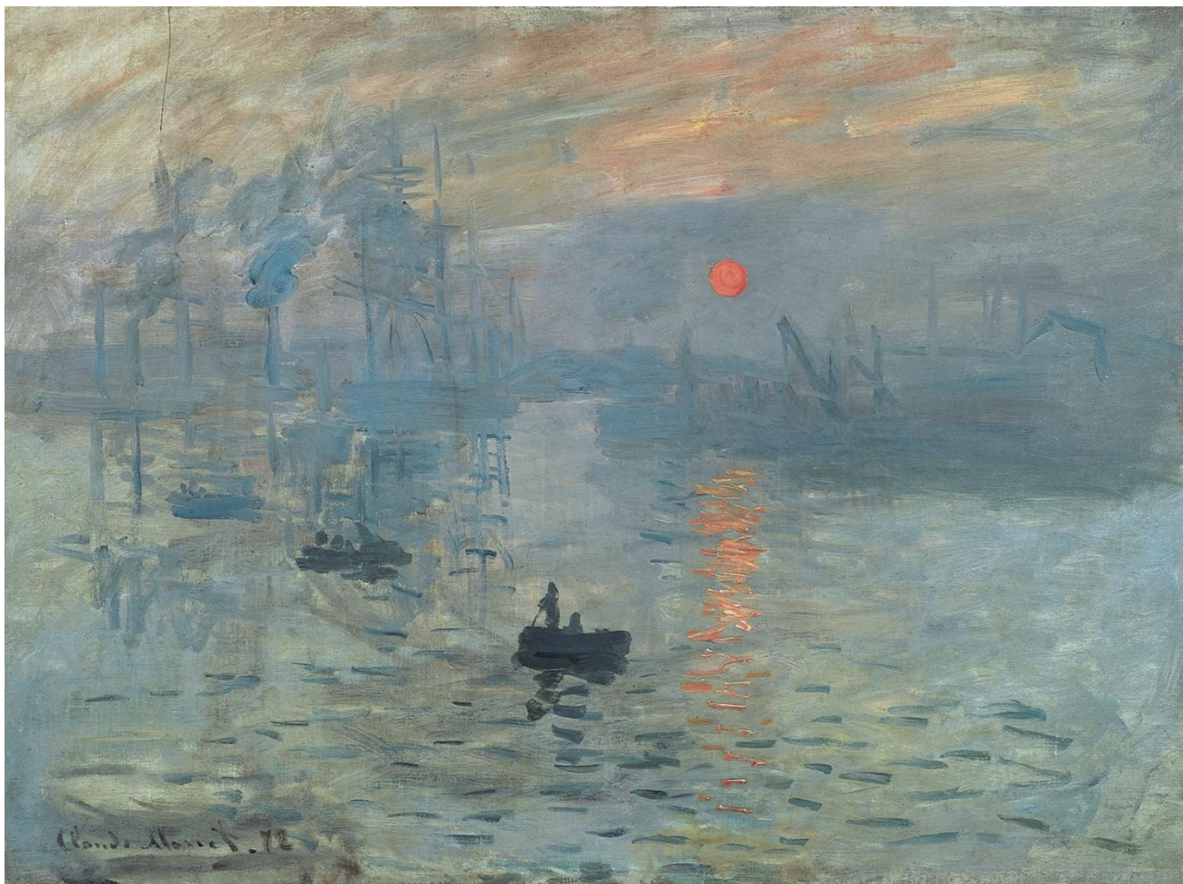
Клод МОНЕ. «Впечатление . Восход солнца ». Импрессионизм