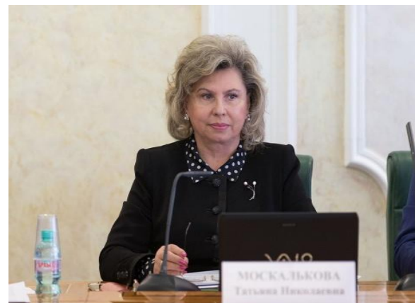
Татьяна Николаевна Москалькова