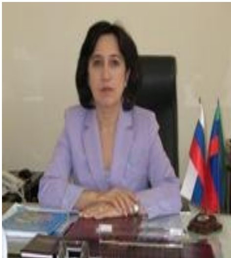
Омарова Уммупазиль Авадзиевна Уполномоченный по правам человека РД