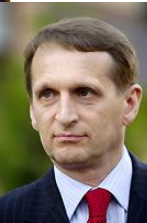
Сергей Евгеньевич Нарышкин

4-й председатель Государственной думы Федерального собрания Российской Федерации