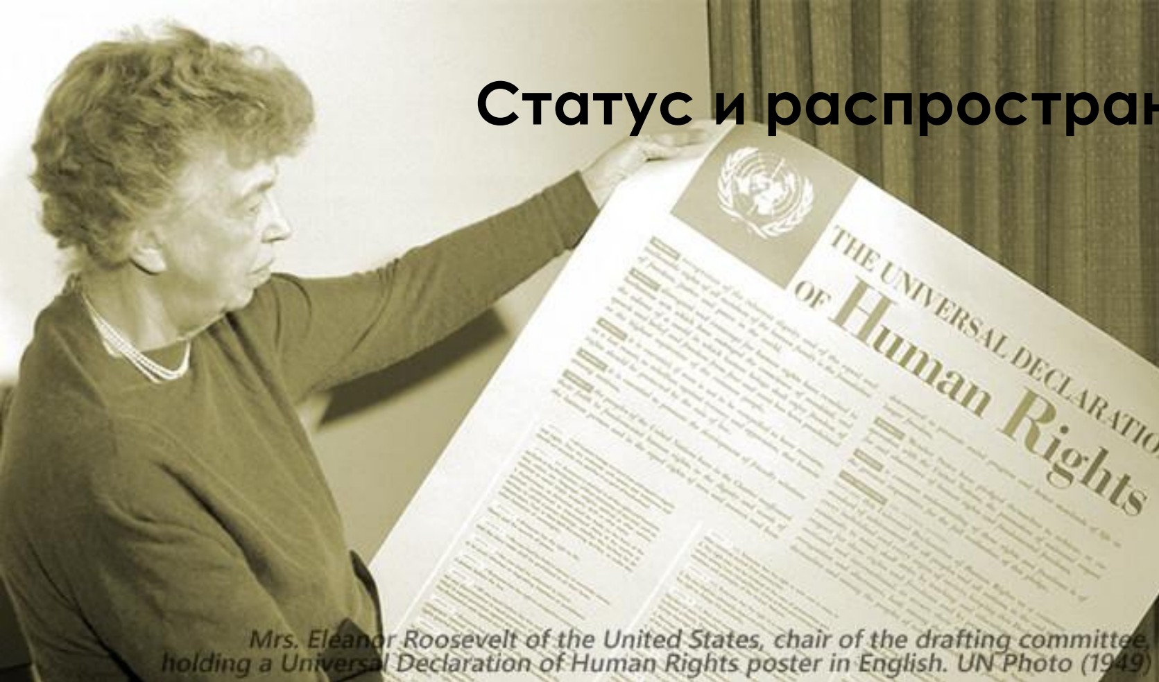
Mrs. Eleanor Roosevelt of the United States, chair of the drafting committee, holding a Universal Declaration of Human Rights poster in English. (1949)