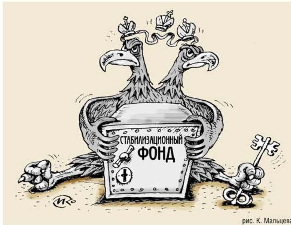
рис. К. Мальцева