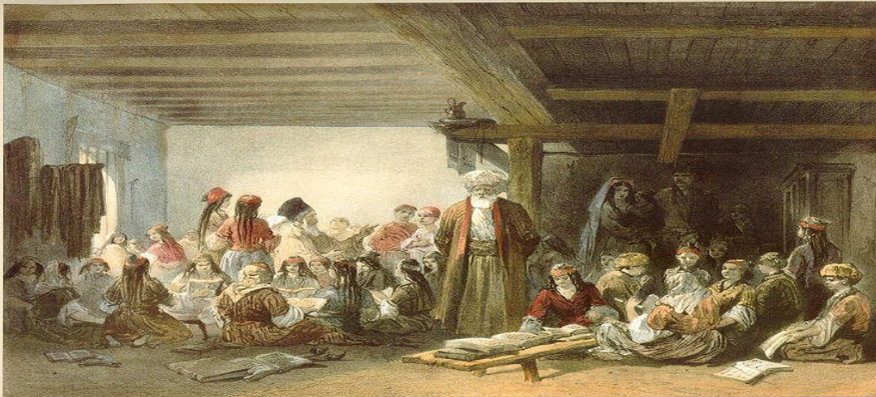
Tartar Children's School