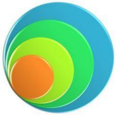
Схема «Социальная среда подростка»