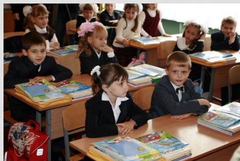
Начальное общее образование