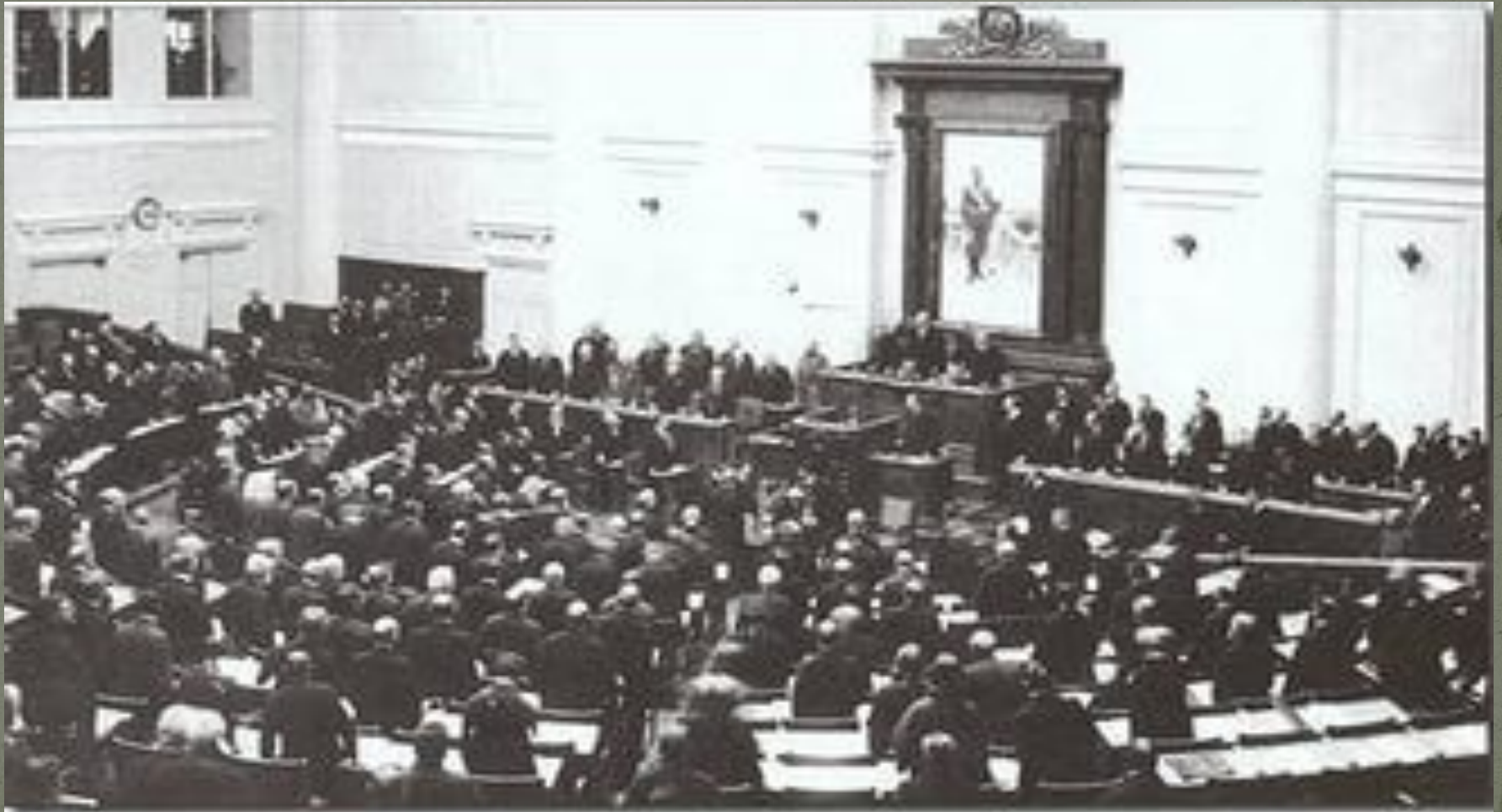
Заседание 3-й Государственной Думы в Таврическом дворце.