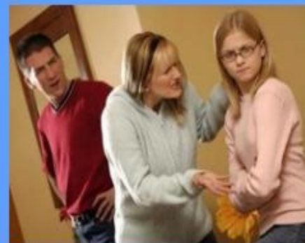
Конфликты с родителями