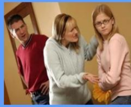
Конфликты с родителями