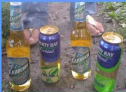
Употребление спиртных напитков