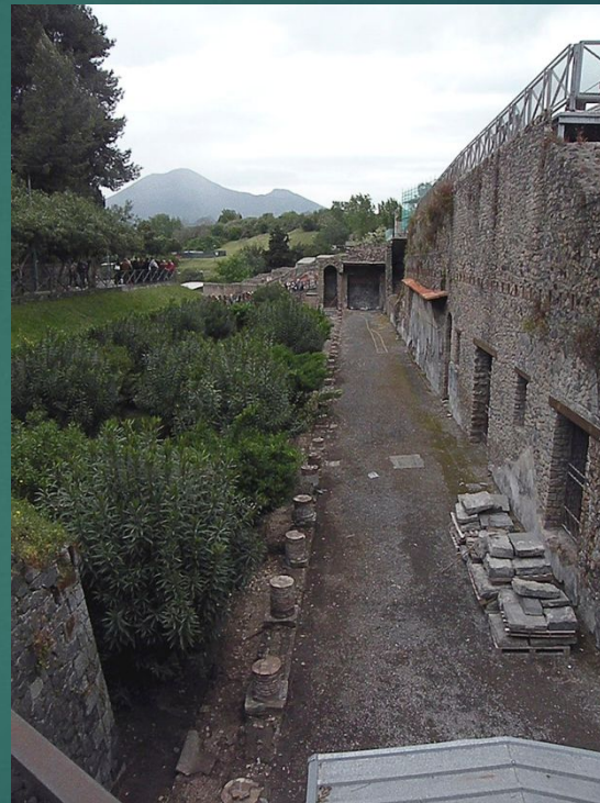
Раскопки города Помпеи.