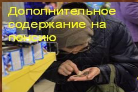
Дополнительное содержание на пенсию