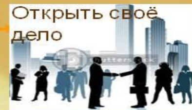
Открыть своё дело