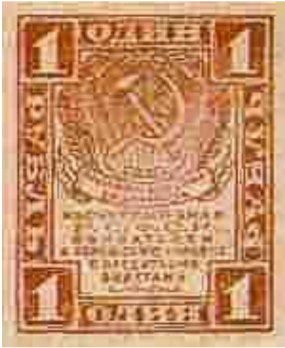
Рубль 1919 года

Первый советский рубль был выпущен в 1919 году в виде кредитного билета.