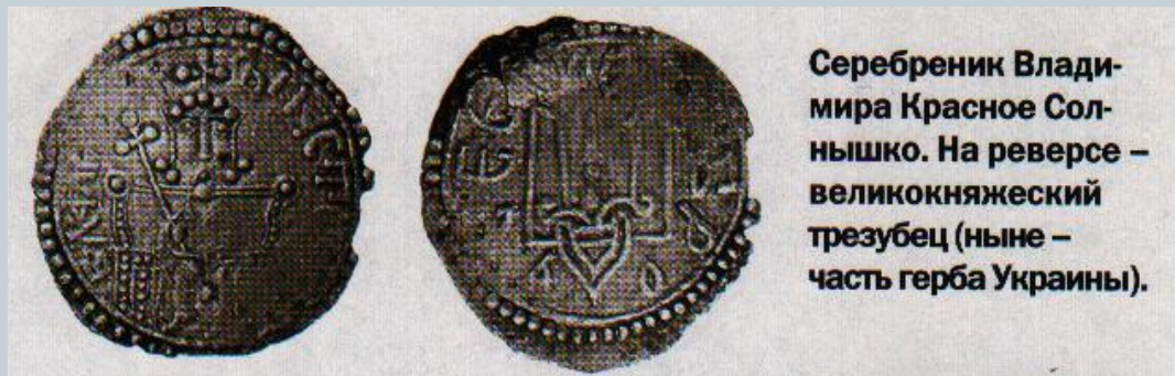
Серебряник Владимира Красное Солнышко. На реверсе – великокняжеский трезубец (ныне – часть герба Украины).

Первые на Руси серебрянники и златники попытались чеканить еще варяжские князья, но эти монеты не прижились.