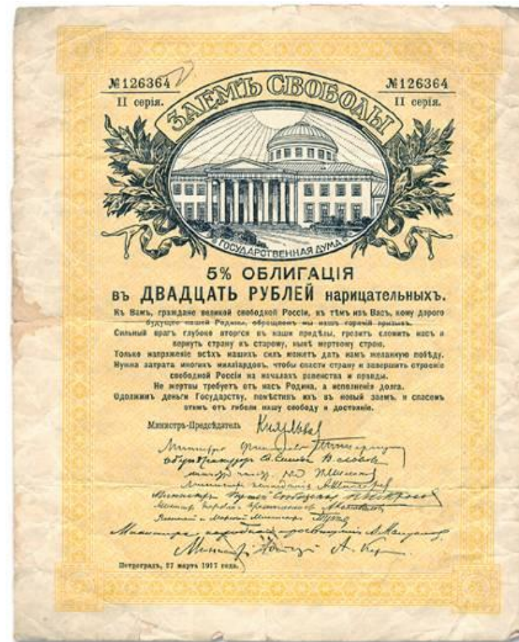
Облигация Временного правительства

Деньги мерили метрами и взвешивали килограммами.