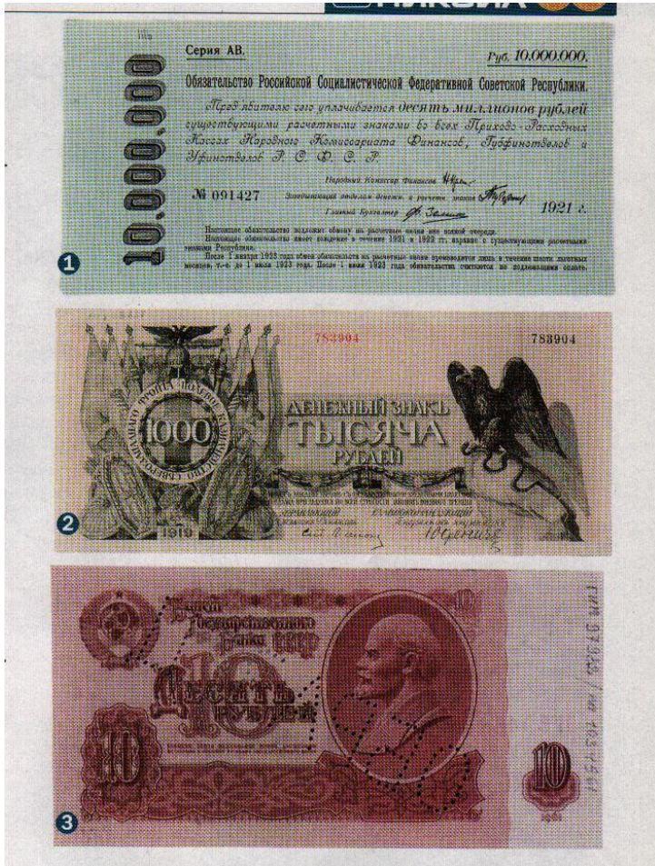
Советские деньги 60-70 годов

Денежная система СССР пережила реформы 1947, 1961, 1991 года