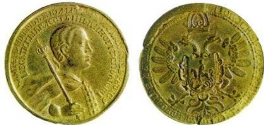
Деньги Лжедмитрия I

В период смутного времени финансовая система страны была расстроена. Деньги чеканили даже самозванцы.