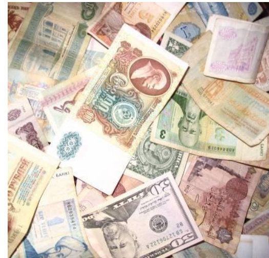
Деньги России и стран СНГ