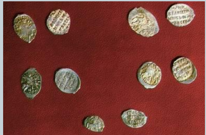
Деньги XVII века

В период Алексея Михайловича деньги «худели» и обесценивались. В XVII веке в России появились иноземные деньги талеры. В 1654 году талеры («ефимки») перечеканили в новые рублевые монеты на которых впервые появилась надпись «рубель».