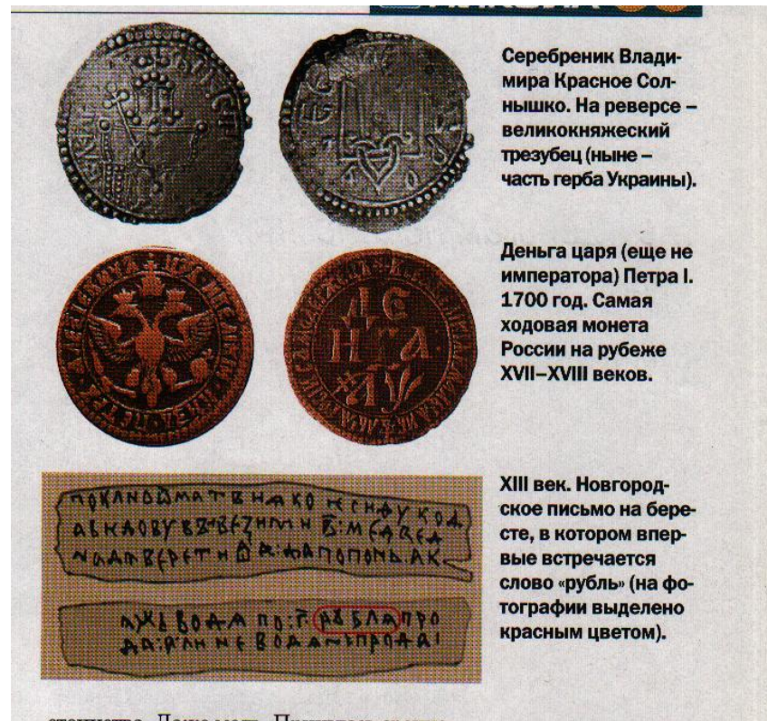
Серебренник Владимира Красное Солнышко. На реверсе – великокняжеский трезубец (ныне – часть герба Украины).

Впервые слово «рубль» упоминается в Новгородской берестяной грамоте. Рублем тогда называли серебряный брусок весом 200 грамм.