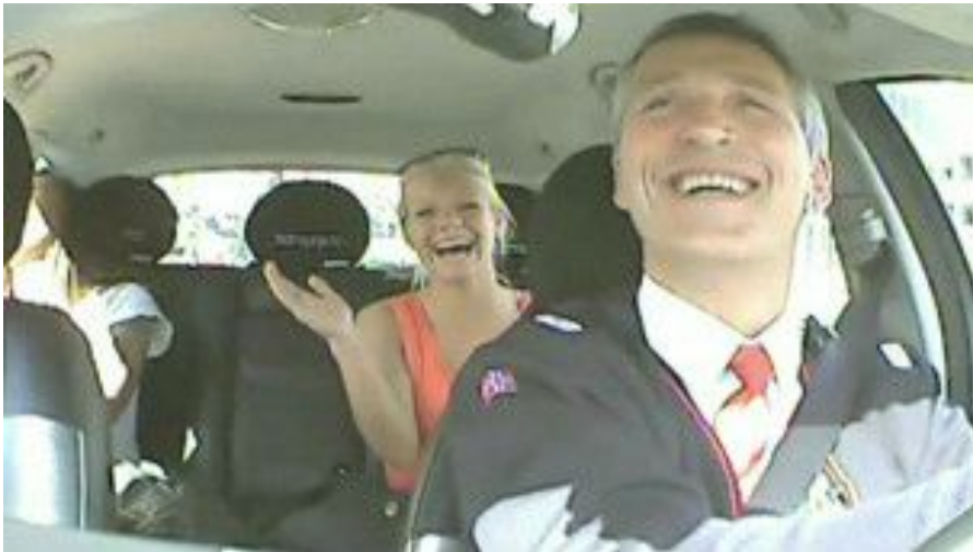
Премьер-министр Норвегии Йенс Столтенберг

Министерство возглавляется министром, членом Государственного совета, в помощь министру назначается статс-секретарь — аналог нашего заместителя министра. Эти два лица назначаются непосредственно премьер-министром, следовательно, политически ангажированы им, нередко потому, что принадлежат к одной с ним политической партии. Естественно, они за редким исключением не являются специалистами в области тех дел, руководить которыми поставлены, но их функции и не заключаются в этом. Они обязаны только следить за тем, чтобы деятельность починенного им министерства строго соответствовала политической линии правительства, вся техническая работа по управлению в министерстве возложена на кадровых чиновников, являющихся главами подразделений соответствующего министерства.