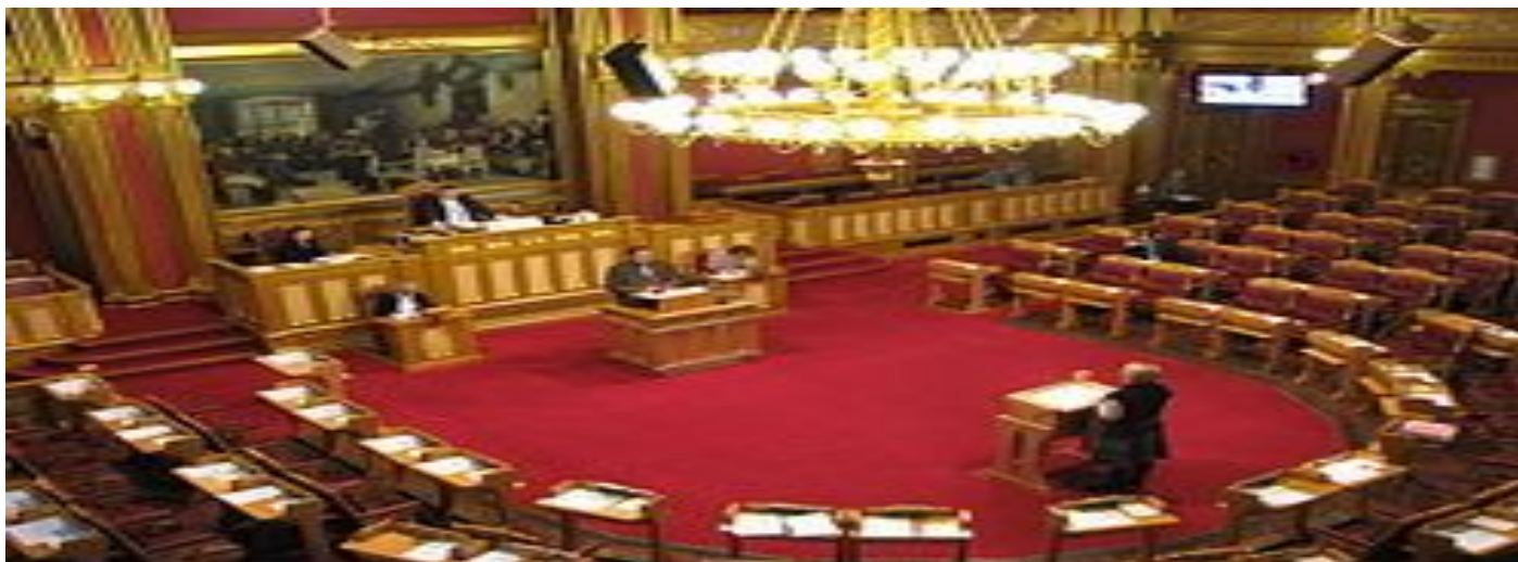
Зал заседаний Стортинга

Стортинг полномочен решать вопрос о форме правления