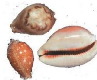
Раковины Каури (Приморье)