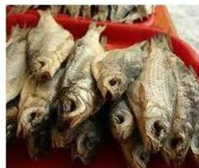
Сушёная рыба (Исландия)

Первые деньги появились очень давно, человечество пользовалось ими далеко не всегда, на слайдах вы видите, что использовалось в качестве денег.