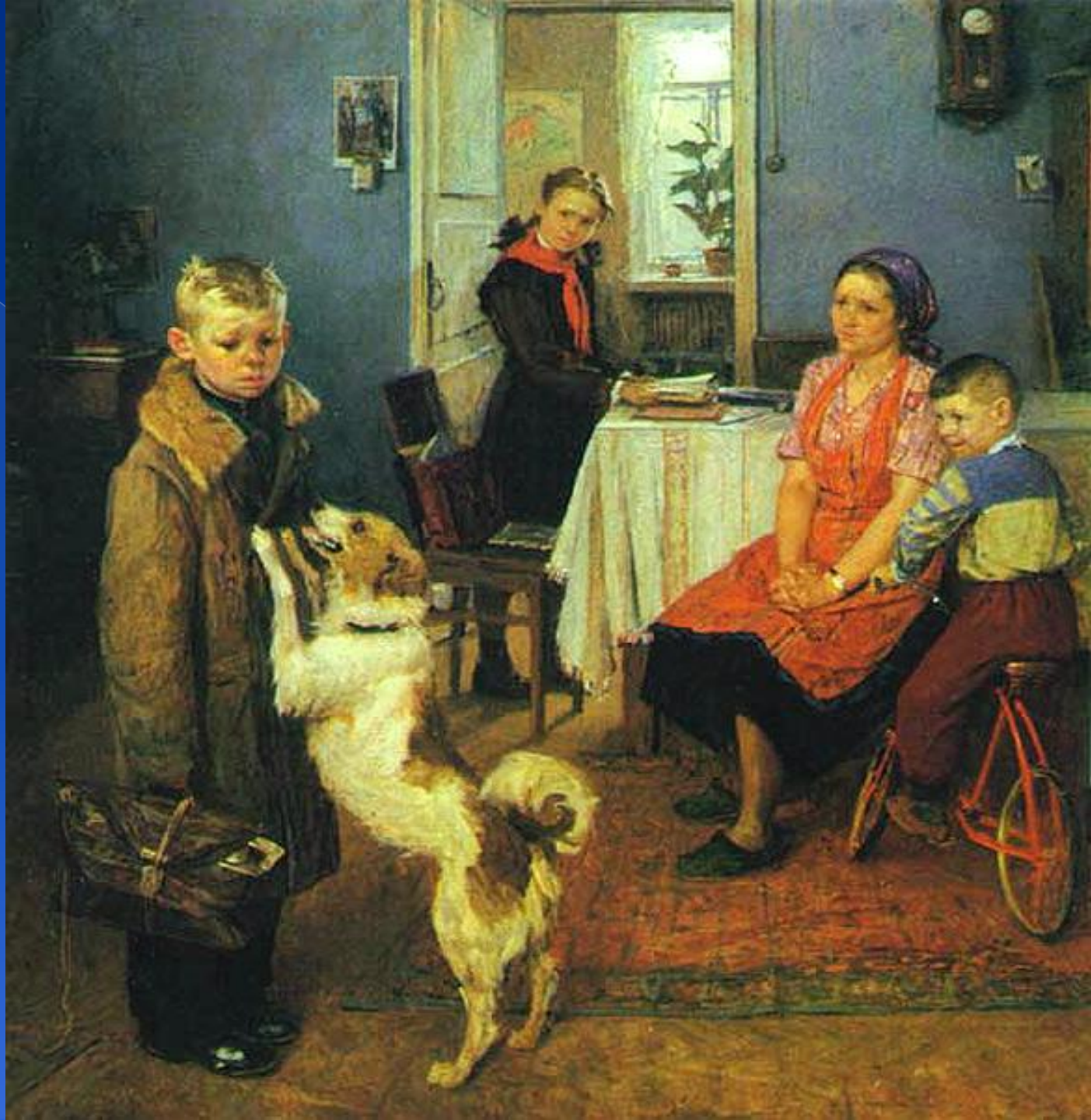
Картина Решетникова Опять двойка . 1952 г.