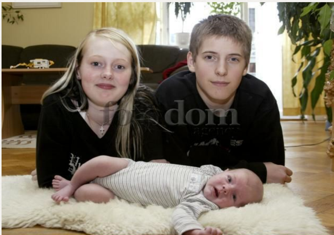
www.fotodom.ru SP00-09 03 Scan Pix Самая молодая пара родителей Швеции: отцу 13, матери - 15 лет, Харносанд, сентябрь 2003.

Несовершеннолетние родители имеют права на совместное проживание с ребенком и участие в его воспитании