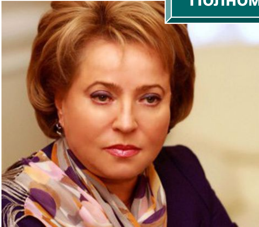
Матвиенко В.И. Председатель Совета Федерации