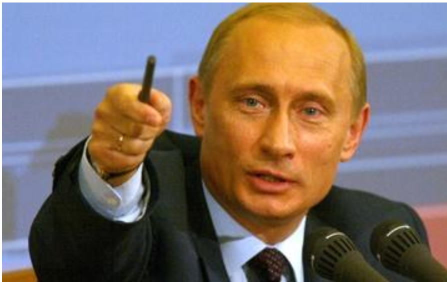
Путин В.В. (род. 1952 г.)

Представляет Совету Федерации кандидатуры для назначения на должности судей Конституционного суда, Верховного суда и др. федеральных судов, а также кандидатуру генерального прокурора