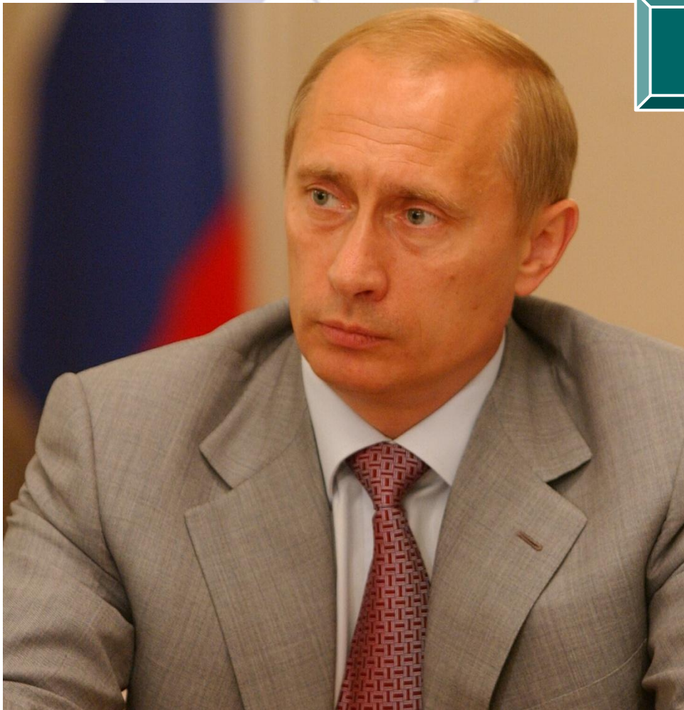
Путин В.В. (род. 1952 г.)