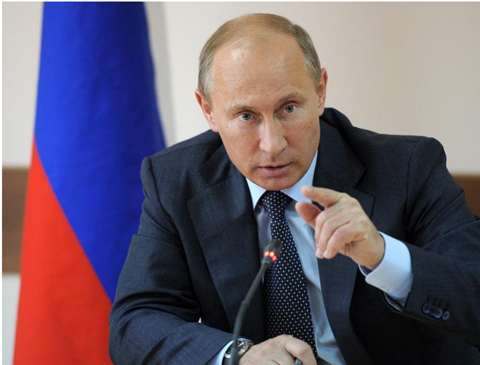
Путин В.В. (род. 1952 г.)