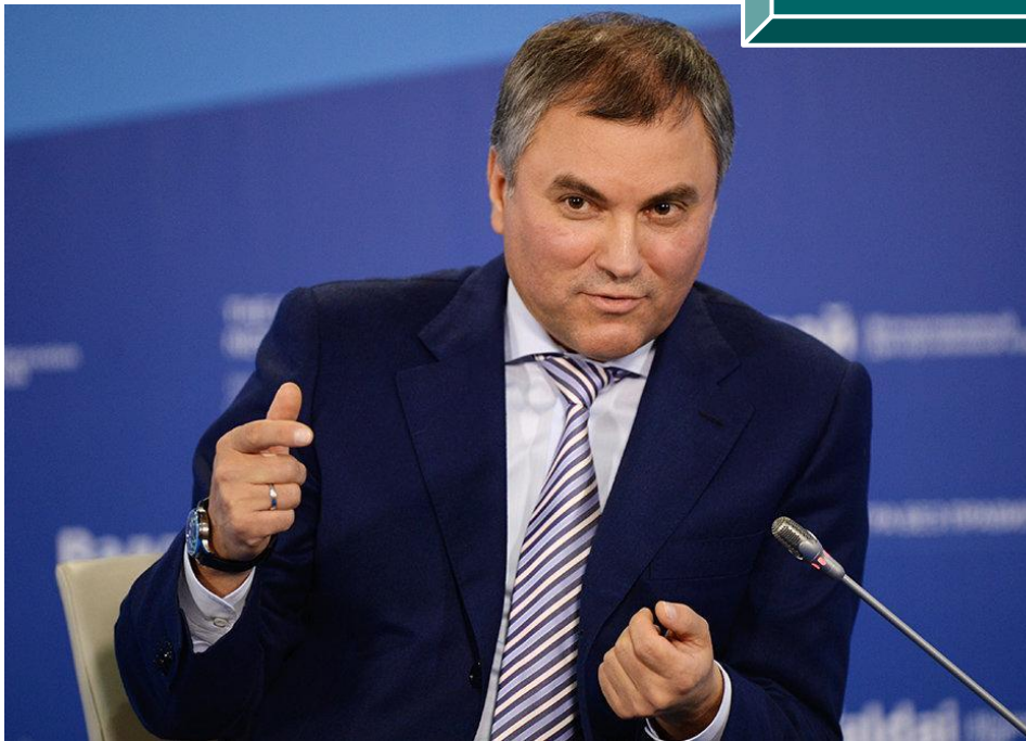
Володин В.В. Председатель Государственной Думы

Назначает и снимает с должности Председателя Центрального Банка, Счетной Палаты, Уполномоченного по правам человека