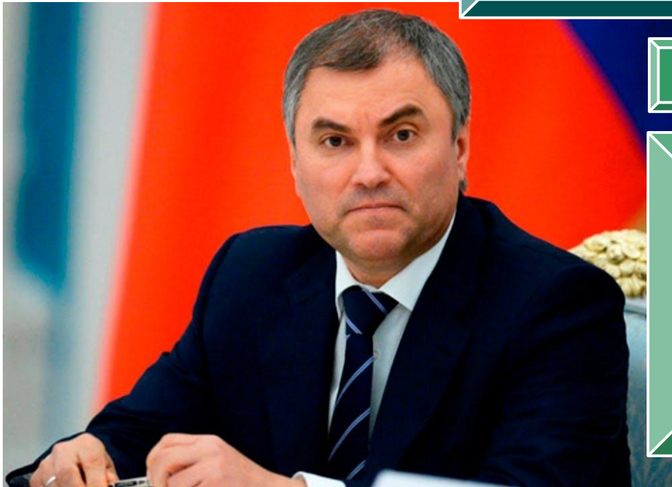
Володин В.В. Председатель Государственной Думы

Выдвигает обвинения против Президента РФ для отрешения его от должности