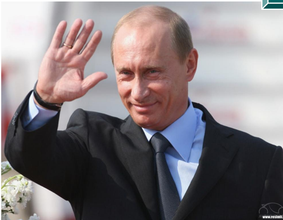
Путин В.В. (род. 1952 г.)