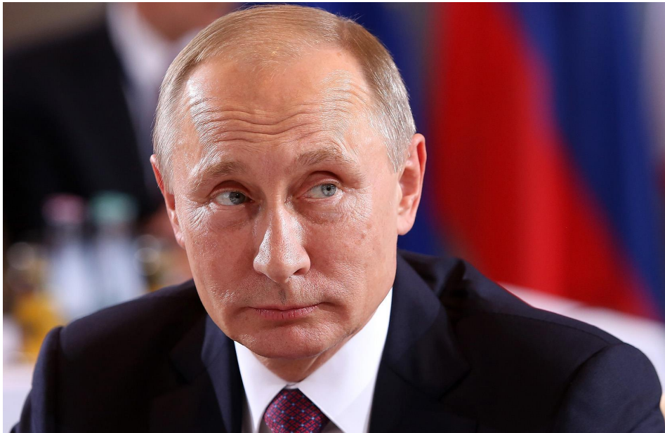
Путин В.В. (род. 1952 г.)