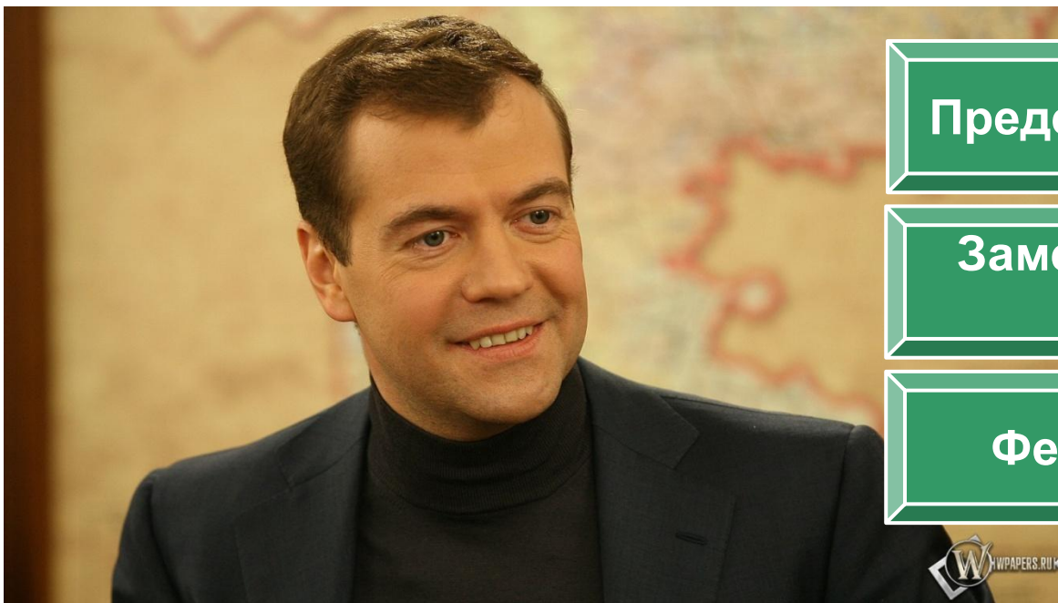
Медведев Д.А. (род. 1965 г.) председатель Правительства