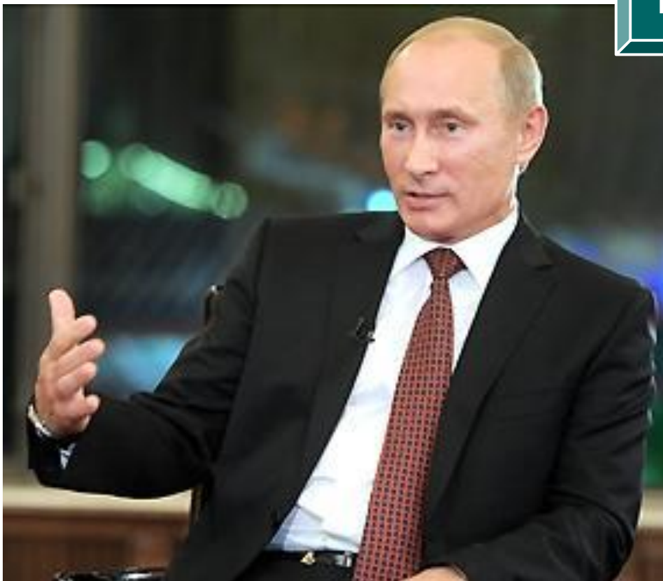
Путин В.В. (род. 1952 г.)