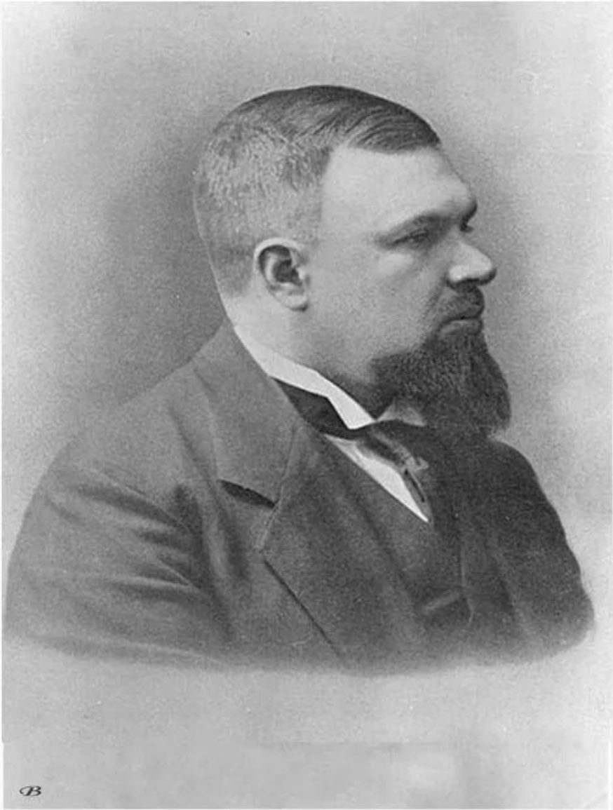
Владимир Павлович Рябушинский