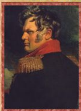
Генерал от инфантерии ЕРМОЛОВ Алексей Петрович (1777-1861)