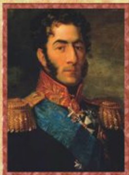
Генерал от инфантерии БАГРАТИОН Петр Иванович (1765-1812)