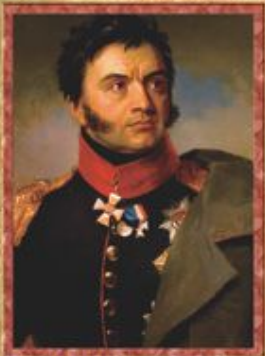
Генерал от кавалерии РАЕВСКИЙ Николай Николаевич (1771-1829)