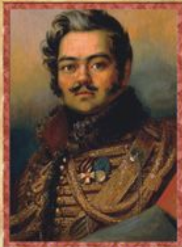
Генерал-лейтенант ДАВЫДОВ Денис Васильевич (1774-1839)