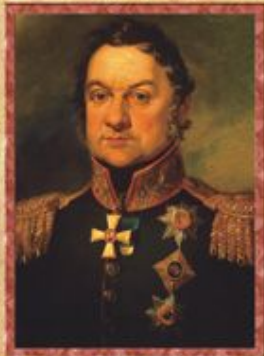
Генерал от инфантерии ДОХТУРОВ Дмитрий Сергеевич (1759-1816)