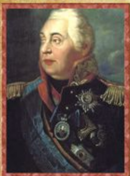
Генерал-фельдмаршал КУТУЗОВ Михаил Илларионович (1745-1813)