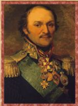
Генерал от кавалерии ПЛАТОВ Матвей Иванович (1753-1818)