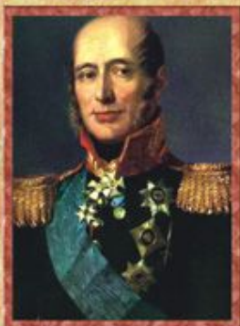
Генерал-фельдмаршал БАРКЛАЙ де ТОЛЛИ Михаил Богданович (1761-1818)