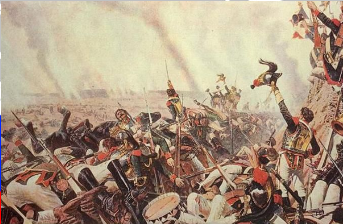
Верещагин В.В. Конец Бородинского боя