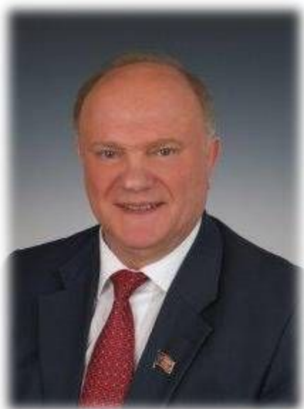
Зюганов Геннадий Андреевич