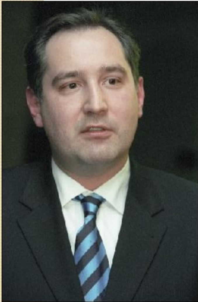
Основатель Дмитрий Рогозин