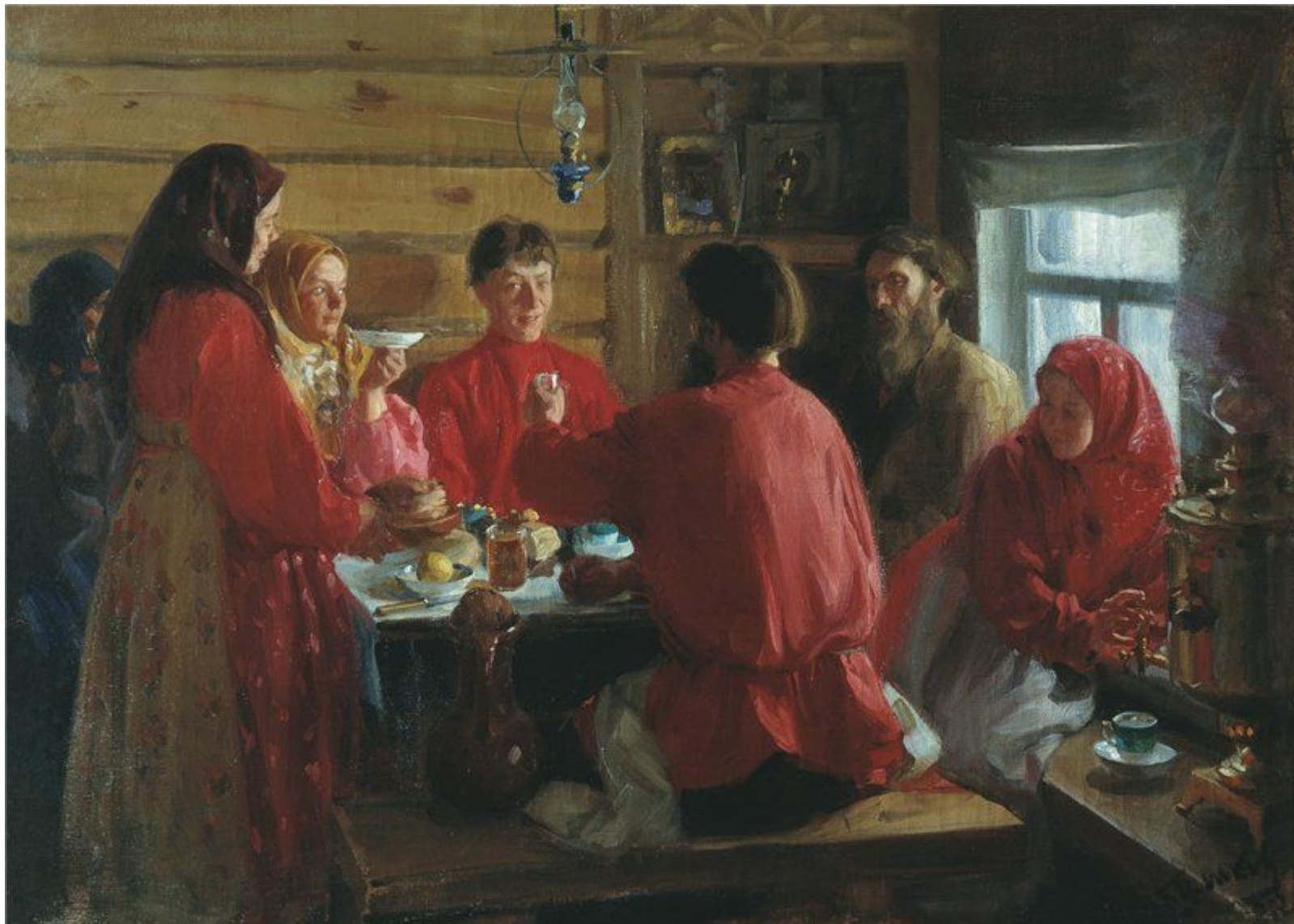
Традиционная или патриархальная семья.