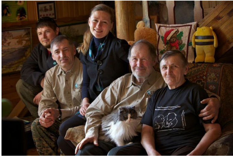
Медвежьи спасатели д. Бубуницы