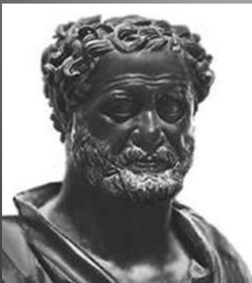
Гераклит - древнегреческий философ, представитель ионийской школы

Педагогика – это наука о воспитании и обучении человека. Зародилась она ещё в Древней Греции и переводится с древнегреческого буквально как «детоведение, детовождение».