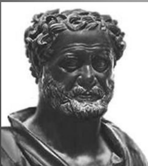
Гераклит - древнегреческий философ, представитель ионийской школы

Педагогика – это наука о воспитании и обучении человека. Зародилась она ещё в Древней Греции и переводится с древнегреческого буквально как «детоведение, детовождение».