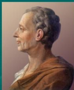
Шарль Луи де Монтескье 1689-1755