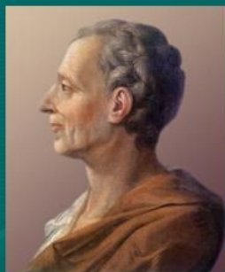
Шарль Луи де Монтескье