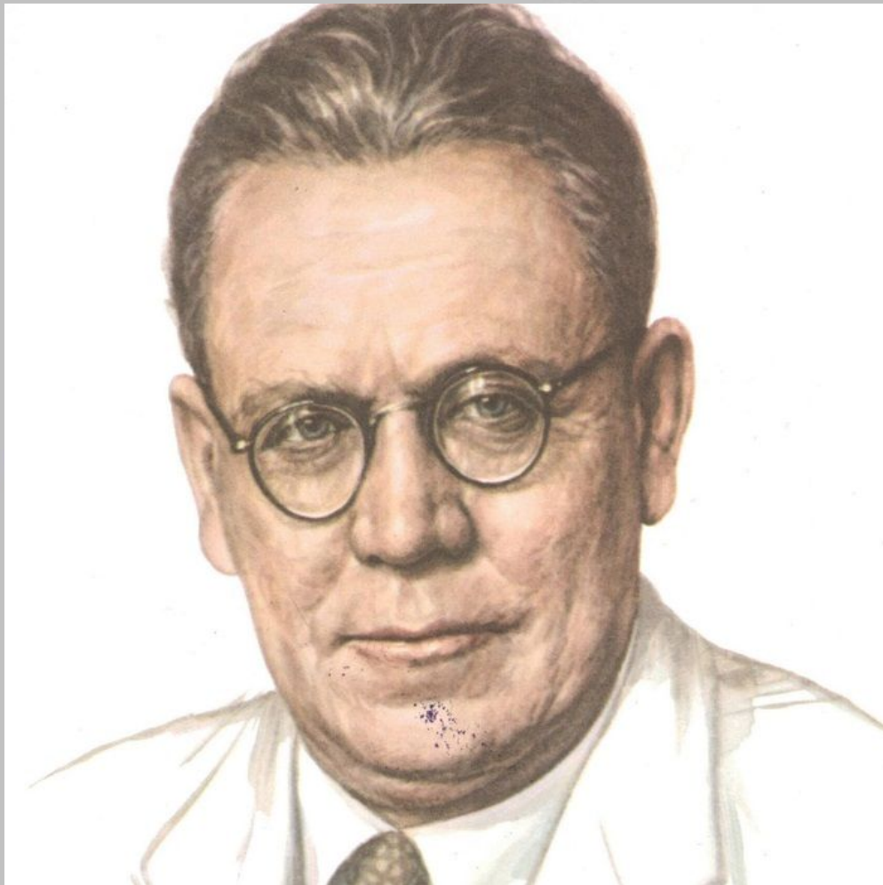
С. Я. Маршак (1887 – 1964 гг.) - поэт