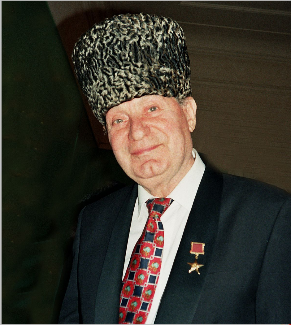
Махмуд Эсамбаев (1924 – 2000 гг.) – артист балета