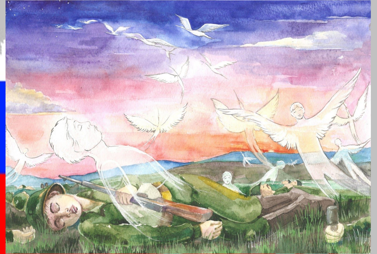
Расул Гамзатов (1923 – 2003 гг.) – поэт