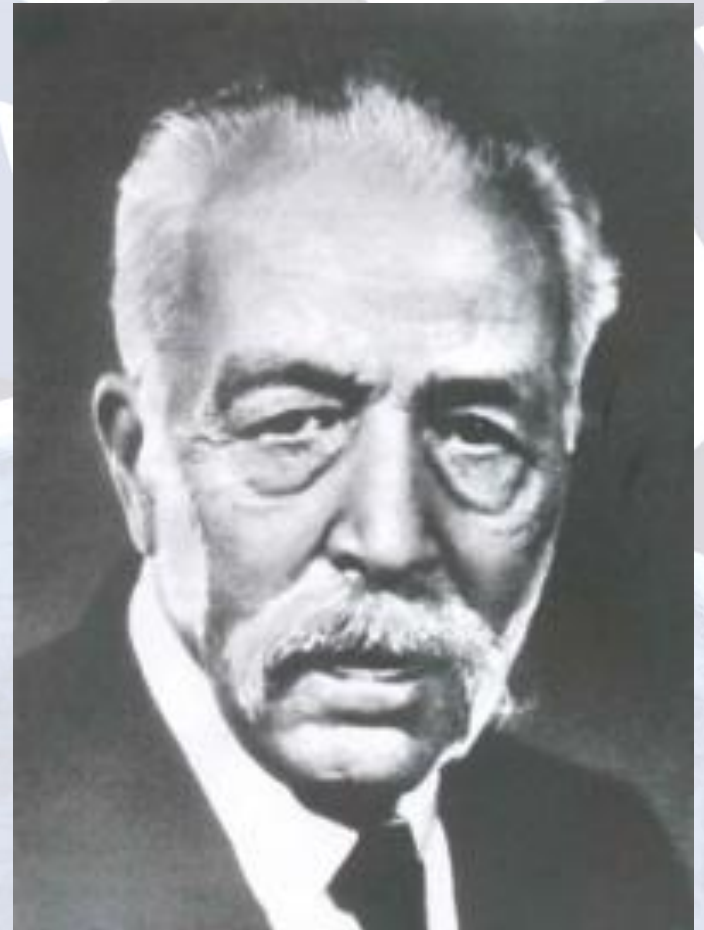
Гаэтано Моска (1858-1941) – создатель теории элит

В чём основная мысль этой теории? (стр. 180)