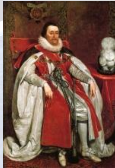
Яков I Английский. Его упрямство привело к революции