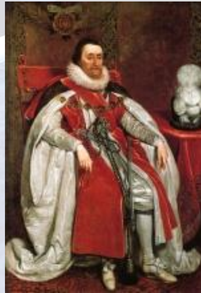
Яков I Английский. Его упрямство привело к революции