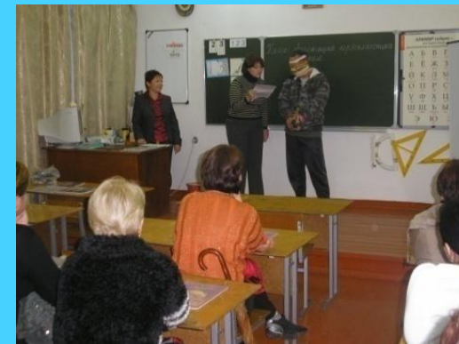
День открытых дверей