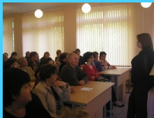
Клуб выходного дня