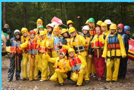
Работа с соцпедагогом